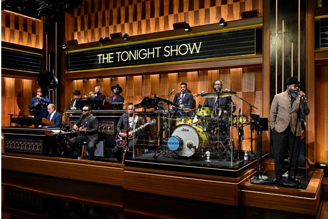
Slika 10: The Roots sastav u emisiji The Tonight Show Starring Jimmy Fallon

koji su uzeli oblik limene glazbe iz New Orleansa i na originalan način pretvorili u punk , hip-hop sastav. Većina bendova u kojem su mlađi svirači, održavaju svoju karijeru turnejama, dok tradicionalni bendovi sviraju na pogrebima i nekim manjim događajima (John Joyce 2024).