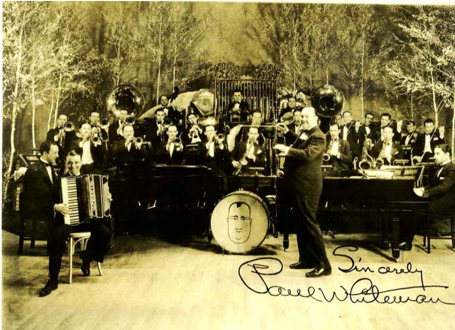
Slika 11: Paul Whiteman i njegov orkestar

Tuba je bila u standardnom sastavu jazz bendova sve do 1920-ih, kada je zamijenjena kontrabasom iako se ponekad koristio suzafon. 1949. godine Miles Davis je uključio tubu u studijska snimanja koja su kasnije izdana kao album Birth of the cool . Orkestar Paula Whitemana ima mnogo fotografija na kojima su dva suzafona smještena na oba kraja benda. Dionica tube je uglavnom bila ista kao i kod žičanog bas instrumenta. Tuba se počela tretirati kao instrument brass sekcije, a ne ritam sekcije, jer su tubisti bili sposobni odsvirati zahtjevnije stvari od jednostavne bas linije. Britanski jazz kompozitori kao što su Kenny Wheeler, Alan Cohen i Darrell Runswick su efektivno iskoristili tubu. Na početku Runswickove skladbe The generals of Islamabad , ritamska linija se svira na solo tubi te se kasnije pridružuju ostali instrumenti kada se ta linija ponavlja (Bevan, 1978).