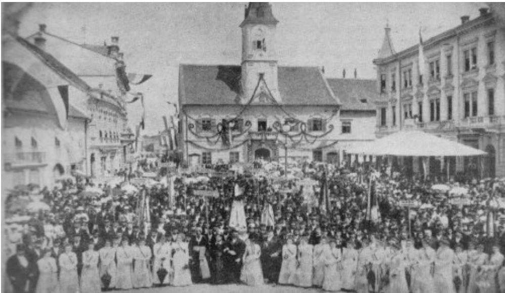
Slika 1: Proslava posvećenja nove zastave hrv. pjevačkog društva Vijenca godine 1901. (Filić, 1972: 273)

Varaždinski radnici i manji obrtnici osnovali su 1886. godine Radničko hrvatsko pjevačko društvo Vijenac kako bi mogli unaprjeđivati svoj stalež. Od 1891. godine uz osnivanje ženskog zbora krenuo je s djelovanjem i tamburaški zbor koji je imao 10 svirača. Vođa i dirigent bio mu je Janko Puchly. Društvo je djelovalo do 1946. godine kada se spojilo s drugim društvom po imenu Sloboda koje će kasnije biti detaljnije opisano. (Filić, 1972: 270 – 275)