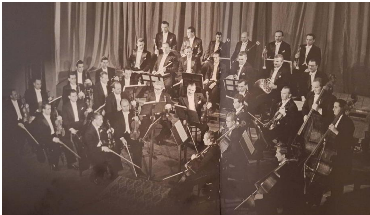
Slika 1: Komorni orkestar Radio – Zagreba, 1951. godine.

Skladatelji su nastojali približiti glazbenu vrijednost široj publici koristeći se kako literarnim sadržajem tako i glazbenom tematikom. Kao odgovor na rastuće zahtjeve publike, angažirano stvaraju i instrumentalna djela nakon što su već razvili svoj rad na ratnim, zbornim kompozicijama. No ipak mlađi skladatelji, posebno u instrumentalnim skladbama, posežu za novim i radikalnijim načinima glazbenog izražavanja. Tada na scenu ulaze svi oni skladateljski postupci koji su se većinom javili u Europi između dvaju ratova, a to su: atonalnost, dodekafonija, aleatorika, proširena tonalnost, politonalnost, serijalnost i kasnije elektronska glazba te nove, avangardne notacije.