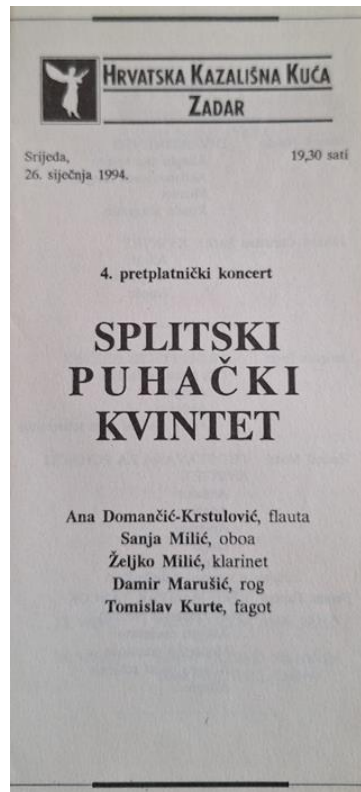
Slika 4: Sastav splitskog puhačkog kvinteta ratne 1994. godine.