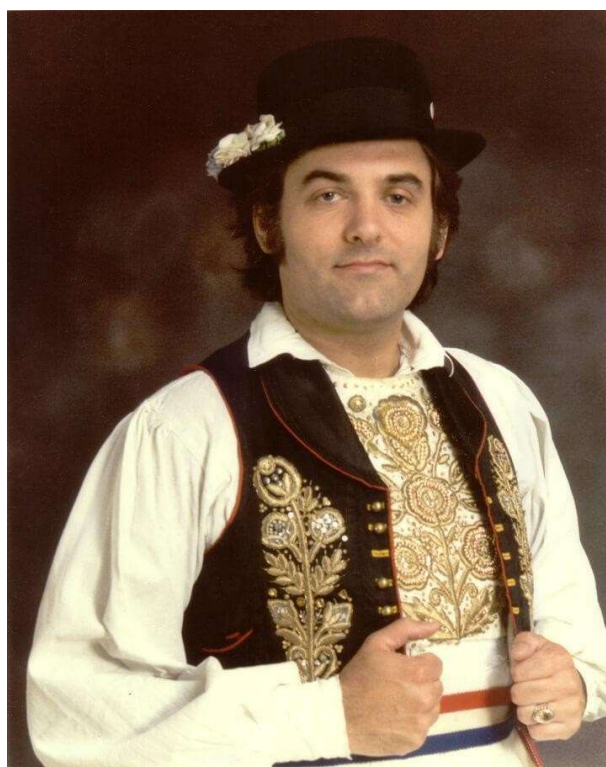
Slika 19: Krunoslav Kićo Slabinac