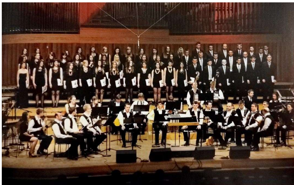
Slika 13: Tamburaška filharmonija na koncertu „Slavonija u Lisinskom” 2014. godine

Tamburaška filharmonija Glazbene škole Požega rezultat je snažnog razvoja tamburaškog i puhačkog odjela. Svoj prvi nastup imala je 2009. godine u Gradskom kazalištu Požega povodom obilježavanja deset godina rada srednje glazbene škole, a prema riječima osnivača i dirigenta Tamburaške filharmonije Veljka Valentina Škorvage, riječ je o jedinstvenom orkestru takve vrste u svijetu (Horvat, 2020: 98). Prvi je nastup obilježilo 64 glazbenika, profesora, učenika i bivših učenika škole, a na programu je bila „Simfonija u D-duru br. 104 (Londonska) - Finale” Josepha Haydna, čime se obilježilo dvjesto godina od skladateljeve smrti, i simfonijska pjesma „Sunčana polja” Blagoja Berse. Nakon toga, značajniji nastupi su „Tiha noć u Vukovaru” 2011., 2012. i 2013. godine, „Bonofest” u Vukovaru 2012. godine i „Slavonija u Lisinskom” 2014. godine. To su samo neki od projekata Tamburaške filharmonije i Mješovitog zbora koji su u suradnji s Hrvatskom radiotelevizijom iskoračili iz lokalnih i regionalnih okvira rada škole. Danas tamburaškom filharmonijom dirigira Dominik Škrabal, koji je autor većine aranžmana za ovaj specifični orkestar.