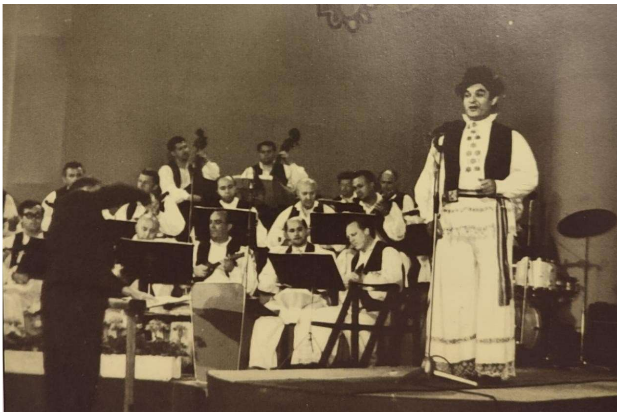
Slika 18: Ivo Robić na „Muzičkom festivalu Slavonije”, 1969. godine