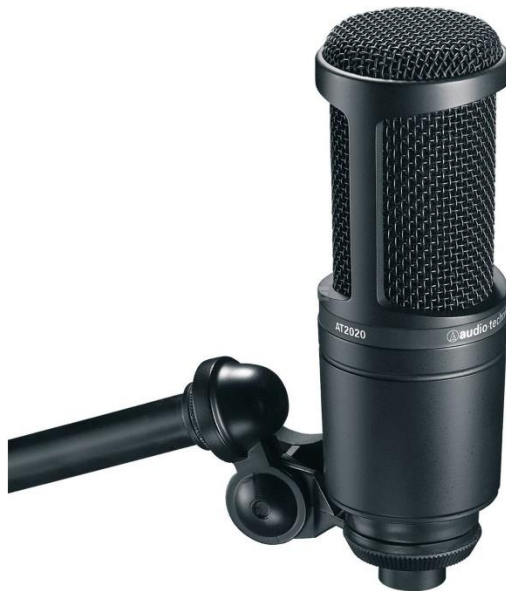
Slika 4: Kondenzatorski mikrofon

Kondenzatorski mikrofon, koji se nekad naziva i elektrostatički, vrsta je pretvarača koja pretvara mehaničku energiju zvučnih valova u napon ili električni signal. Za razliku od ostalih vrsta, koristi se tehnologijom koja se zove promjenjivi kapacitet. Navedena tehnologija funkcionira na način u kojem su element ili kapsula kondenzatorskog mikrofona zapravo specijalizirana vrsta kondenzatora koja kao elektronička komponenta privremeno skladišti energiju.