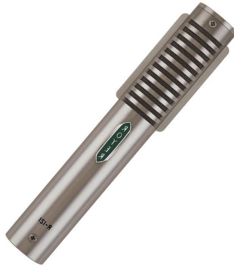
Slika 3: Dinamički mikrofonski s vrpcom

Mikrofoni s vrpcom, iako smatrani zasebnim tipom mikrofona, vrsta su dinamičkog mikrofona, uz dinamički mikrofonski zavojnicom. Svi dinamički mikrofoni rade na isti osnovni način, oni su pretvarači, što znači da su to uređaji koji pretvaraju jedan oblik energije, u ovom slučaju mehaničku energiju zvučnih valova u drugi, u ovom slučaju električni signal ili napon. Obje vrste mikrofona rade to pomoću elektromagnetizma, ali na malo drugačije načine.