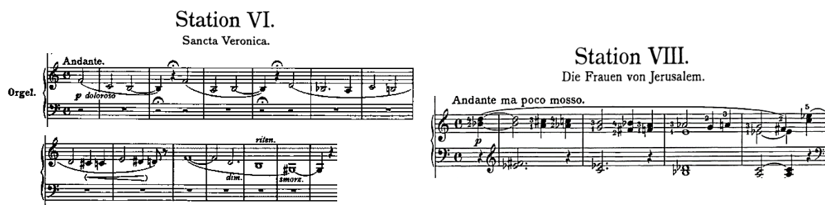
Notni primjer 3. 5. Dokidanje tonalitetnog konteksta

Četrnaest meditacija za zbor, soliste i orgulje oslikavaju postaje Križnoga puta. Dionica orgulja emancipirana je do mjere da su neke postaje isključivo instrumentalne. Harmonijski jezik je izuzetno kromatiziran, a fragmentirane monodijske misli nalik na meditacije u orguljskoj pratnji gotovo potpuno dokidaju tonalitetni kontekst.