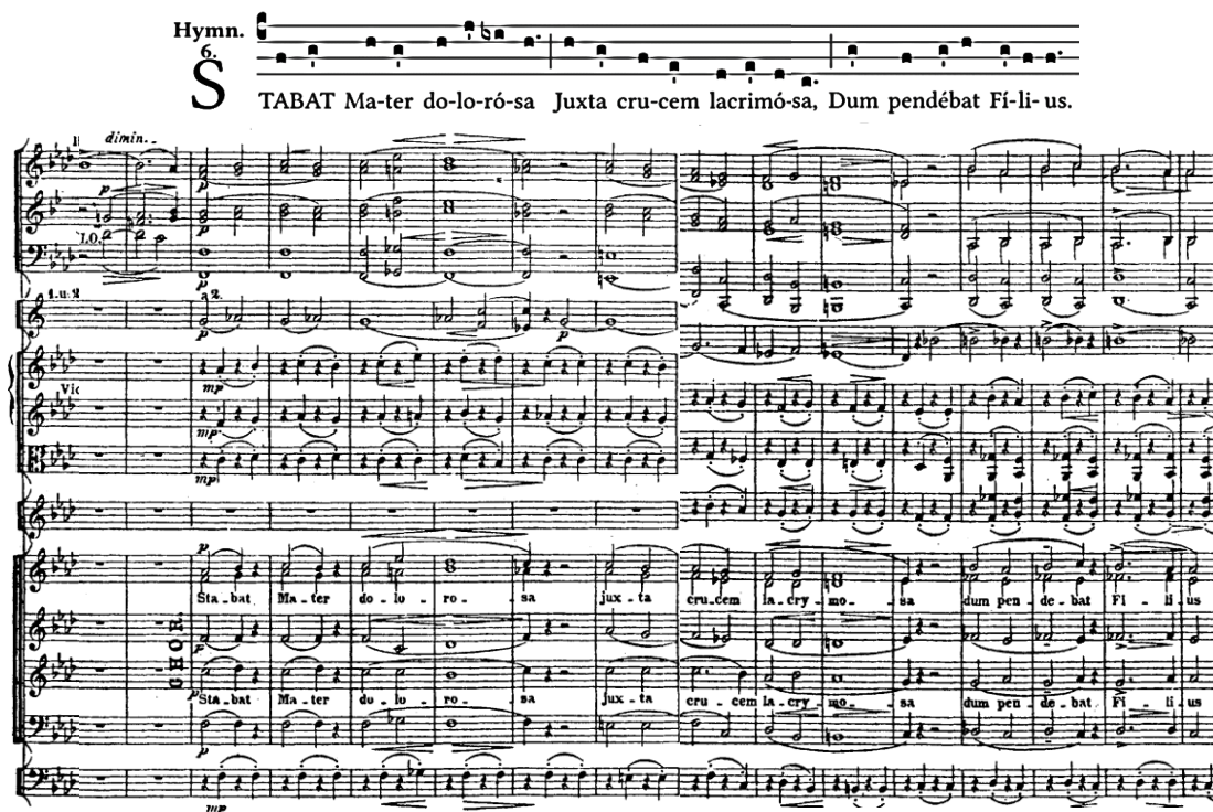
Notni primjer 3. 4. Parafraza sekvencije Stabat Mater dolorosa

Muzička apstrakcija getsemantskih događanja u vidu kontemplativnih borbi između duha i tijela doživljava svoju točku kristalizacije u nadolazećem stavku Stabat Mater dolorosa . On može biti izveden i samostalno zbog opsega i strukture koja je rezultat majstorstva u pokazivanju mogućnosti variranja na istoimenu koralnu melodijsku liniju iz petnaestog stoljeća. Liszt joj pridaje čas introvertnu, tugaljivu i nježnu, a čas ekstrovertnu i dramatski duboko uznemirenu osobnost, što ostvaruje balansiranjem tematskog sadržaja između solistâ i zbora uz instrumentaciju kao koloritom za potkrepu emocionalnog doživljaja.