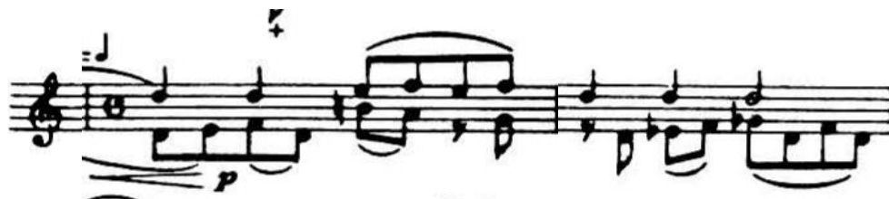
4.3.3. Tematski materijal B u dvohvatima

pojavljaju umetci gdje Šostakovič koristi interval male sekunde. U Più mosso dijelu skladatelj gradi kaotičnu i histeričnu energiju tako što koristi silazne i uzlazne ljestvice u tridesetdruginskom ritmu. Kulminacija ovog stavka preljeva se u uvod četvrtog stavka, Allegro con moto .