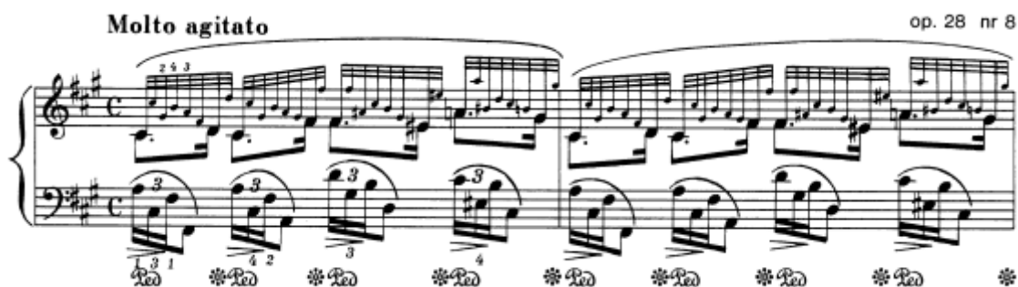
Slika 15. Preludij br. 8 u fis–molu, taktovi 1 – 2

Ovaj preludij, na prvi pogled poput etide, i doista jedan od tehnički zahtjevnijih, sastavljen je od tri razine zvuka koje je potrebno odvojiti. U prvome je planu melodija sastavljena od punktiranog ritma, u srednjem planu su rastavljeni akordi u lijevoj ruci, dok su ostalne tridesetdruginke u desnoj pozadina u svrsci boje. Oznaka je na početku molto agitato , dakle uzbuđeno, označujući dramatičan karakter, s kulminacijom u reprizi koja je označena molto agitato e stretto . Dakle, uzbuđenje treba biti prisutno kroz cijeli preludij i rasti prema kraju. Ta tenzija i strast postižu se stalnim mijenjanjem obojenosti tridesetdruginki, naglašavanjem promjena harmonija i, uvjetno rečeno, tempa, obzirom da uputu stretto u reprizi možemo shvatiti kao malo brži tempo. Dodatni adut u postizanju dramatičnosti je pedal, koji je zapisan u autografu, na početku s puštanjem na zadnju šesnaestinku svake dobe, a kasnije postoje i duži pedali, po dvije dobe, na samome kraju i po četiri.