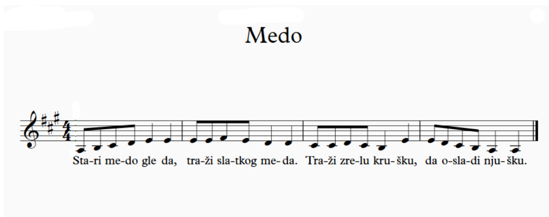
Slika 12. Notni zapis pjesme Medo

Unazad tri održane radionice, shvatili smo kako djeca najbolje reaguju na pjesme te se njihovom primjenom postiže veći učinak u usvajanju riječ negoli brojalicama. Često učenje i upamćivanje brojalica djeci predstavlja problem te gube interes i želju za radom, dok primjena pjesama, s druge strane potiče zainteresiranost, veselje i zadovoljstvo djece. Kod ponavljanja sadržaja svake radionice, djeca se uvijek najprije sijete pjesama koje smo na prethodnim radionicama učili, dok se tijekom učenih brojalica ponekad uopće ne sjećaju. Kako bih otkrili razloge ovakvih ishoda, odlučili smo pjesmicu Medo djeci najprije predstaviti u obliku pjesme, a kasnije kada usvoje riječi iste, pretvoriti je u brojalicu, odnosno ritmičko izgovaranje teksta. Svakako treba naglasiti kako je originalna forma pjesmice Medo upravo napisana u stilu brojalice, no dodavši joj melodiju, odlučili smo je pretvoriti u pjesmu te je u tom obliku predstaviti djeci.