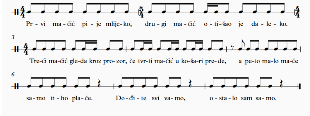
Slika 6. Notni zapis brojalice Pet malih mačića

Nedovoljno razvijena fina motorika, ċest je problem djece romske nacionalnosti koji se u većini sluċajeva otkriva prekasno. Pjesma Male ruke pak, s druge strane potiče razvoj motorike ruku i nogu primjenom pljeskanja, tapkanja i skakanja.