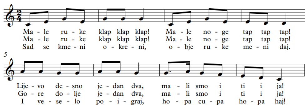
Slika 7. Notni zapis pjesme Male ruke

Primjena aktivnosti u kojima pokret te aktivno sudjelovanje imaju važnu ulogu, kod djece rodi većim plodom te ih potiče i ohrabruje na daljnje aktivno sudjelovanje. Također, ċeste promjene te primjena razliċitih vrsta aktivnosti vrlo su pogodne za