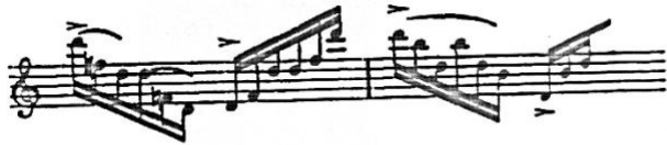
Slika 5. Brahmsova prva alternativna ideja (Schwarz, 1984)

Brahms šalje komentar: „ Ne mogu prihvatiti promjenu koju si predložio u sljedećoj pasaži. “ 16 U pismu predlaže par alternativnih verzija jer ne želi odustati od visokih i niskih početnih nota u pasaži.