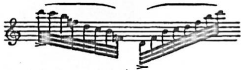
Slika 6. Brahmsova druga ideja za istu pasažu (Schwarz, 1984)