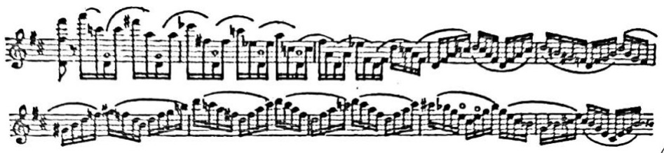
Slika 1. Brahmsova prva verzija pasaža u uvodnom djelu (Schwarz, 1983)

Brahms je često tražio od Joachima da „nažvrlja“, prekriži ili promijeni neke stvari u partituri, a pritom ga je tražio savjete i ideje kako bi raspolagao s više opcija tijekom komponiranja. No unatoč tim molbama, često je bio tvrdoglav te se nije slagao sa Joachimovim prijedlozima koji se tiču violinske tehnike, a kada bi se složio pokazalo bi se da je Joachimov prijedlog bio od presudne važnosti. Suradnja s Joachimom testirala je Brahmsovu inventivnost jer je trebao često osmišljavati alternative. U sljedećim primjerima prikazat će se neke od izmjena koje su prethodile Joachimovim utjecajem.