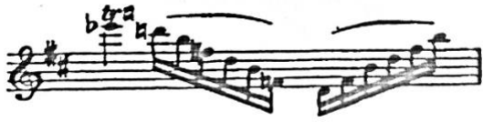
Slika 4. Joachimova korekcija (Schwarz, 1984)

Brahms šalje komentar: „ Ne mogu prihvatiti promjenu koju si predložio u sljedećoj pasaži. “ 16 U pismu predlaže par alternativnih verzija jer ne želi odustati od visokih i niskih početnih nota u pasaži.