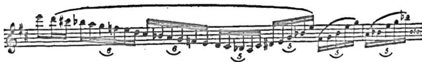
Slika 10. Finalna verzija (Schwarz, 1984)