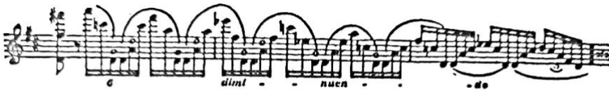
Slika 3. Joachimova korekcija zapisana u holografskom izdanju crvenom tintom (Schwarz, 1983)

Sljedeći primjeri mogu se pronaći u pismu br. 393 te br. 394 koji se odnose na ekspoziciju u prvom stavku – Brahms nije htio prihvatiti korekcije koje je Joachim poslao te mu šalje par primjera s komentarima te alternativnim verzijama, pri čemu u finalnoj verziji ostaje Brahmsova ideja.