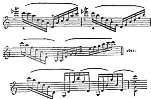
Slika 7. Joachim šalje ponovni prijedlog sa komentarem: „Dragi Brahms! Možda je dobro.“ (Schwarz, 1984)

Sljedeći primjeri ukazuju na ponovni Joachimov prijedlog koji je prihvaćen od strane Brahmsa.