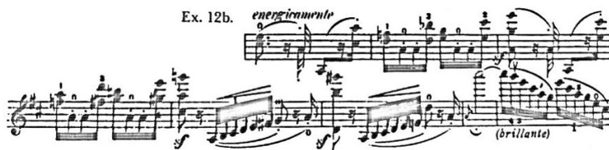
Slika 12. Joachimova verzija koja je dodana dosta kasnije u holografsku partituru (Schwarz, 1984)