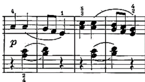
Slika 5: II. stavak, 17. - 20. takta

Valja napomenuti da je barokni utjecaj sve više prisutan u poznim godinama Beethovenova života i stvaralaštva te da kroz njega kida karike tjelesne ograničenosti. Sjedinjenjem dviju značajki baroknog stila; fuge i ariosa u trećem stavku, obrazlaže svoju internu potrebu da stvara u baroknoj maniri, u kojoj načinom spajanja homofonije i polifonije pokazuje majstorstvo objedinjenja glazbenih formi.