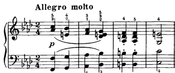
Slika 4: II. stavak, 1. - 4. takta