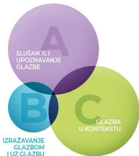
Slika 1. Zastupljenost domena u četvrtom i petom odgojno-obrazovnom ciklusu

U kurikulumu nastave Glazbene umjetnosti navedeni su obvezni i preporučeni sadržaji koji se moraju obraditi tijekom dva odgojno-obrazovna ciklusa. Nastava Glazbene umjetnosti u općoj, jezičnoj i klasičnoj gimnaziji se održava po četverogodišnjem programu (137 sati sveukupno), u prirodoslovno-matematičkoj gimnaziji po dvogodišnjem programu (70 sati sveukupno), a u prirodoslovnoj gimnaziji u trajanju od jedne godine (64 sati godišnje), a također je navedeno dvanaest izbornih tema. Od nastavnika se očekuje da će realizirati minimalno četiri izborne teme za program od 137 sati (četverogodišnji program), to jest dvije izborne teme za program od 70 ili 64 sata (dvogodišnji/jednogodišnji program). U tablici su prikazani obvezni i preporučeni sadržaji po Kurikulumu (Tablica 6.)