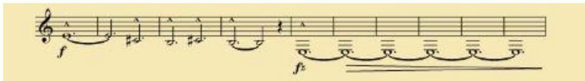
Slika 5. Sunčana polja – tema A (Zov sunčanih polja)

Ova simfonijska pjesma sastoji se od tri glavne teme (Slika 5., 6. i 7.) koje će se učenicima predstaviti i kroz slušanje glazbenog djela, a one se izmjenjuju unutar skladbe i tvore slobodni glazbeni oblik. Simfonijsku pjesmu izvodi simfonijski orkestar, a limeni puhači nastupaju iza pozornice, pritom šireći okvire pozornice (Šimićević, 1999).