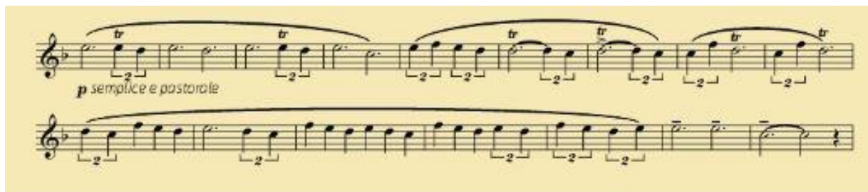
Slika 7. Sunčana polja – tema C (Pjesma seljaka)