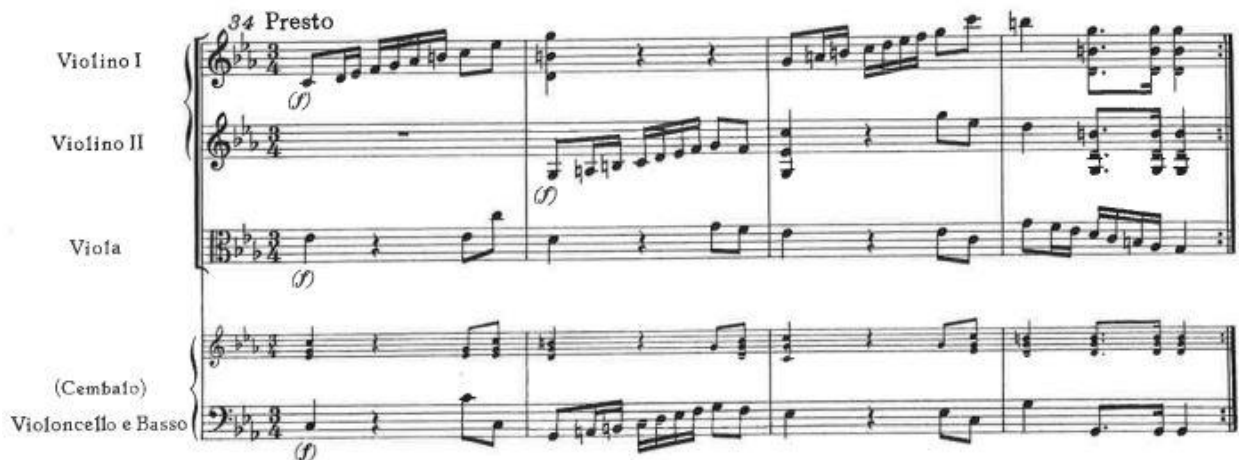
Slika 2. Ples furija – instrumentalni uvod

U razgovoru s nastavnikom učenici spoznaju da unutar radnje, u ovom odlomku furije stoje na ulazu podzemnog svijeta te u razgovoru s Orfejem mu dopuštaju ulazak u podzemlje, gdje ga čeka Euridika.