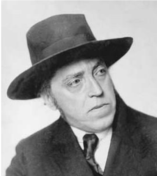
Prilog 10. Blagoje Bersa