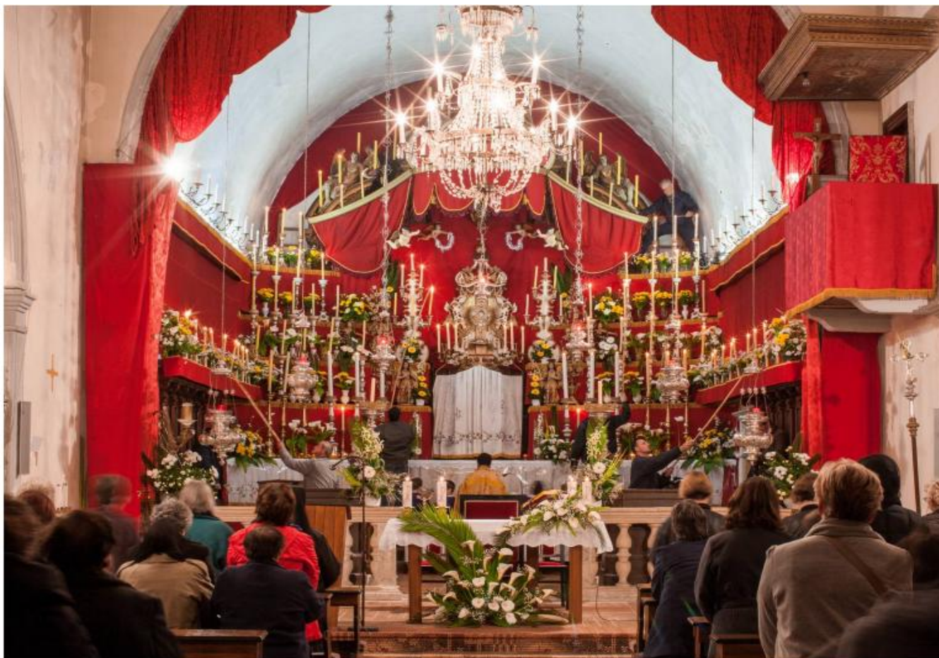
Slika 3 Kvarantore u Komiži u crkvi sv. Nikole ( Muster )

Tijekom zajedničke ure klanjanja gori više od 120 voštanica u prostoru ispunjenom brojnim cvijećem.