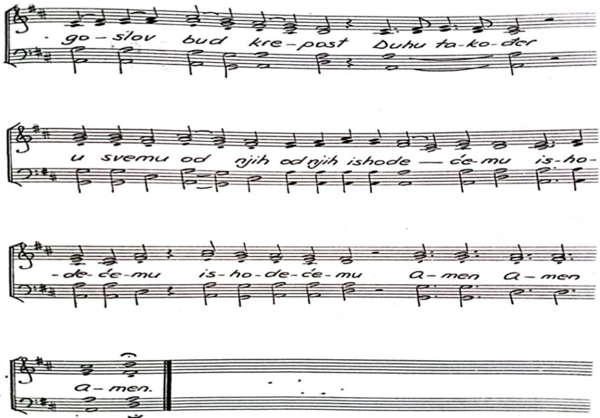
Slika 5 Zapis napjeva Svetotajstvu

Crkvena pučka tradicija Komiže koju izvodi zbor i puk jesu i pjevane marijanske litanije u mjesecu svibnju te pjevana pobožnost križnoga puta u vremenu korizme. Autor marijanskih litanija svibanjske pobožnosti je komiški župnik don Andrija Vitaljić (rodnom Komižanin), a nastale su u 17. stoljeću.