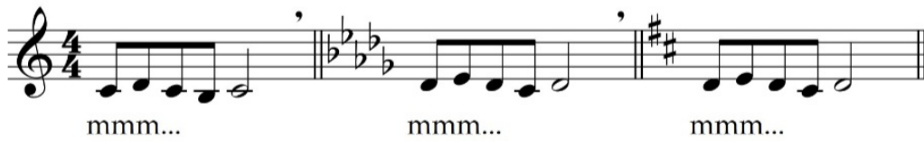
Primjer 5. „Vježba mumljanja“