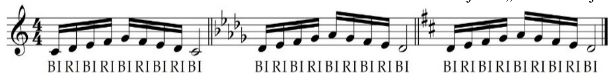
Primjer 8. „Kombinacija vokala i konsonanata“

Primarni cilj vježbi upjevavanja je upravo impostacija glasa, pomoću raznih vježbi „kultivirati glas tako, da svi tonovi glasovnog opsega teku s lakoćom, slobodno i prirodno. Da bi se postigla ova idealna zamisao lakoće i jednostavnosti, potrebno je sistematsko obrazovanje i preodgajanje mišića“ 26 , na što su usmjerene vježbe upjevavanja.