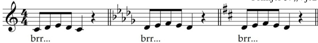
Primjer 6. „Brujalica“