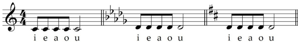
Primjer 7. „Vokaliziranje“