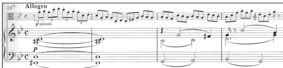
Triolski motiv Allegra

Triolski motiv se nastavlja do kraja uvoda.