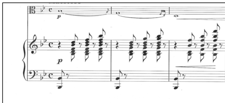
Početak a dijela

Stavak započinje uvodom naslova Maestoso . Oblika je male trodijelne pjesme, a karakterizira ga spori tempo, note dugog trajanja u violskoj dionici te klavirska pratnja. Prvi dio (a) oblikom je perioda s proširenjem te se sastoji od jednostavnih motiva i akorda na stupnjevima B-dura s pedalnim tonom B.