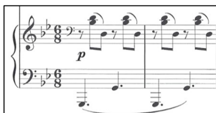
Glavni motiv pratnje

Prvi pravi nastup klavira kao ravnopravne dionice violi pojavljuje se tek u codetti gdje se prvi put javlja drugačiji motiv, iako inspiriran prethodnim. Novi motiv karakterističan samo za codettu gradi napetost, prvo u dionici klavira, uz još uvijek stalnu pratnju dionice lijeve ruke. Nakon nastupa klavira, viola iznosi isti materijal gradeći još uvijek napetost koja svoj vrhunac doživljava kad viola preuzme ritmički motiv pratnje klavira, prvi put u svrhu melodije. Uz kadencu, skoro ad libitum , A dio se smiruje i privodi kraju te nastupa B dio.