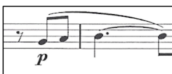
Glavni motiv teme

Andante con moto (A) započinje u g-molu, dvotaktnim uvodom u klaviru prije nego započne viola s izvedbom melodije. Njegov oblik je mala dvodijelna pjesma s codettom . Sama tema, a tako i tempo izvođenja, otkrivaju zašto se stavak zove upravo Barcarolla . Trodobna (šestosminska) mjera i spor, ali pokretan tempo karakteristike su ovog tradicionalnog napjeva, čija je trodobnost s naglašenom prvom dobom povezana sa zaveslajima gondolijera. Melodija je također vrlo karakteristična za pjesmu, veoma liriska, skoro kao da je pisana za glas, a ne za violu. Glavni motiv teme je ritmički obrazac koji se od prvog nastupa do kraja dijela neprestano pojavljuje.