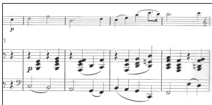
Ulomak b dijela

Dio a' pojavljuje se kao svojevrsna repriza, ponovno kao perioda s proširenjem.