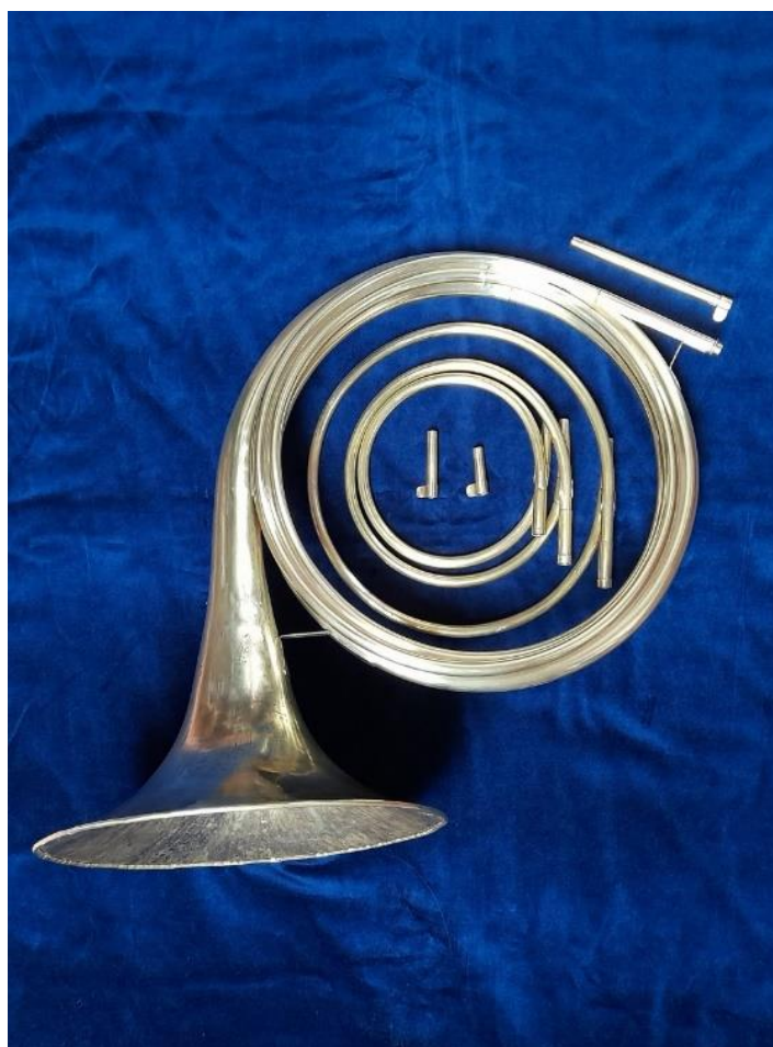
slika 4.1.f, Kerner 1760

U nastavku intervjua izražava nezadovoljstvo prema lošim kopijama baroknih rogova s kojima se možemo susresti, zbog čega je započeo sâm izrađivati prirodne rogove. U izradi se drži točnih mjera, promjera i tehnike izrade. U intervjuu je priložio fotografiju baroknog roga koji ima karakteristike vjerodostojne razdoblju baroka (slika 4.1.f), a riječ je o modelu Kerner 1760 , kakvoga je sredinom 18. stoljeća izrađivao bečki graditelj instrumenata Anton Kerner (1726. – 1806.). 11 Kao glavne karakteristike ovog modela roga Katte navodi veliku i malu usnu cjevčicu, lemljene cijevi (s time da trideset centimetara od ruba lijevka zvučnika ne smije biti lemljeni spoj) i lijevak zvučnika koji je izrađen ručno. Francuski skladatelj i muzikolog Jean-Benjamin de La Borde (1734. – 1794.) u svom radu Essai sur la musique ancienne et moderne (Esej o staroj i modernoj glazbi) iz 1780. g. opisuje Kernerove rogove ovim riječima: „Rogovi iz Beča u Austriji, koje je izradio g. Kerner, najbolji su za koncerte.“ 12