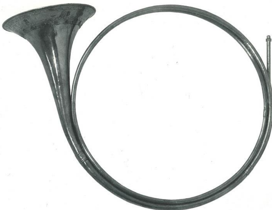
Slika 2.b, lovački rog

Nažalost, malo je očuvanih originalnih rogova iz razdoblja baroka. Očuvani barokni rogovi rijetko su dostupni prosječnom glazbeniku: ili su izloženi u muzejima, ili su cijenom preskupi. Zato se u današnje vrijeme preporuča nabava replike, tj. instrumenta koji je vjerna kopija baroknog roga. Mnogo je kvalitetnih obrtnika koji izrađuju veoma uspješne replike prirodnih i baroknih rogova. Svaki od njih ima svoju posebnost u izradi i dizajnu, a završni produkti visoke su kvalitete.