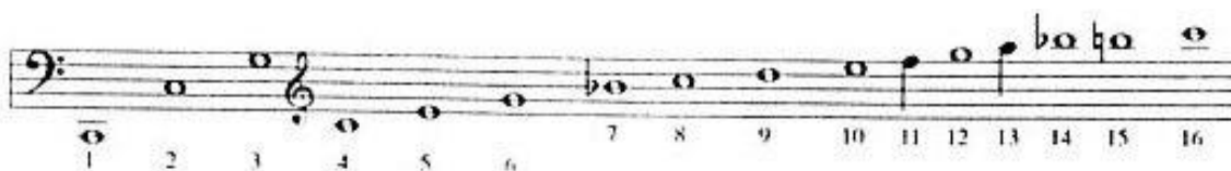
notni zapis 1.

„Koncept rupica može se ukratko opisati na sljedeći način: ako su prirodni rog ili truba postavljeni, na primjer, na noti C (notni zapis 1.), proizvest će seriju alikvota na temelju tona C, pri čemu će jedanaesti alikvotni član (koji odgovara tonu F) biti viši od tona F u jednako temperiranoj ugodbi ili u bilo kojoj povijesnoj nejednakoj ugodbi, a trinaesti alikvotni član (koji odgovara tonu A) biti prenizak.