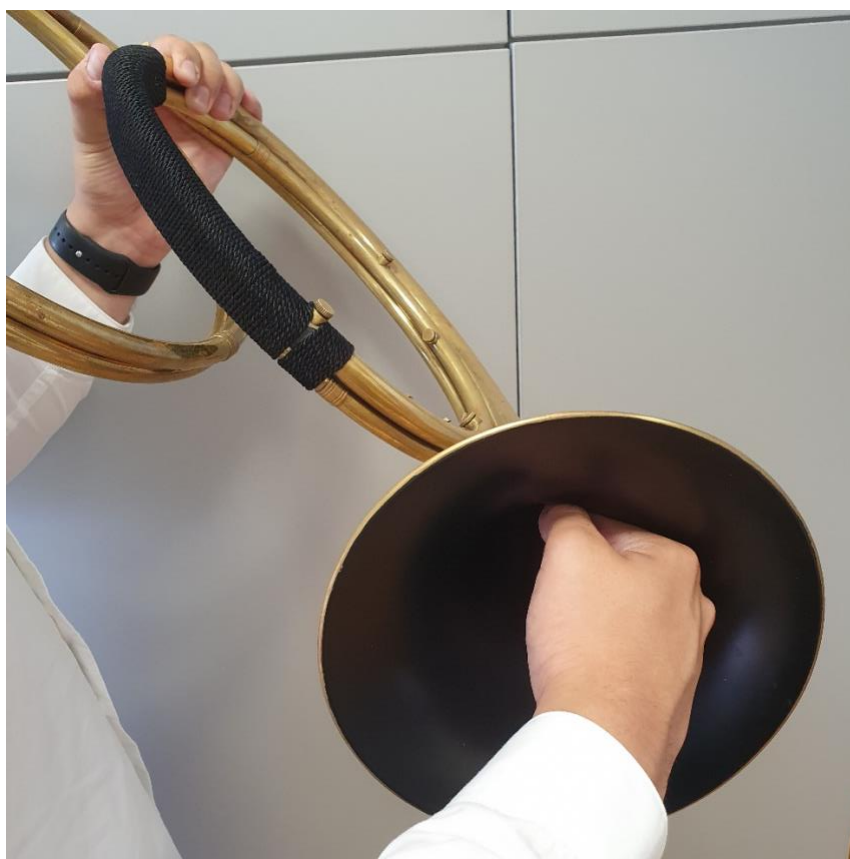
Slika 3.1.c, ruka u lijevku zvučnika

Sviranje pomoću ruke unutar lijevka zvučnika neupitno je najčešće upotrebljavani način sviranja roga općenito. Poželjno je da svaki izvođač koji se odluči za ovu tehniku ima istančani sluh. U tu svrhu koristi se desna ruka unutar lijevka zvučnika (slika 3.1.c), koja je ključna za intonativnu točnost, ne samo na baroknom rogu, nego i na današnjim modernim rogovima.