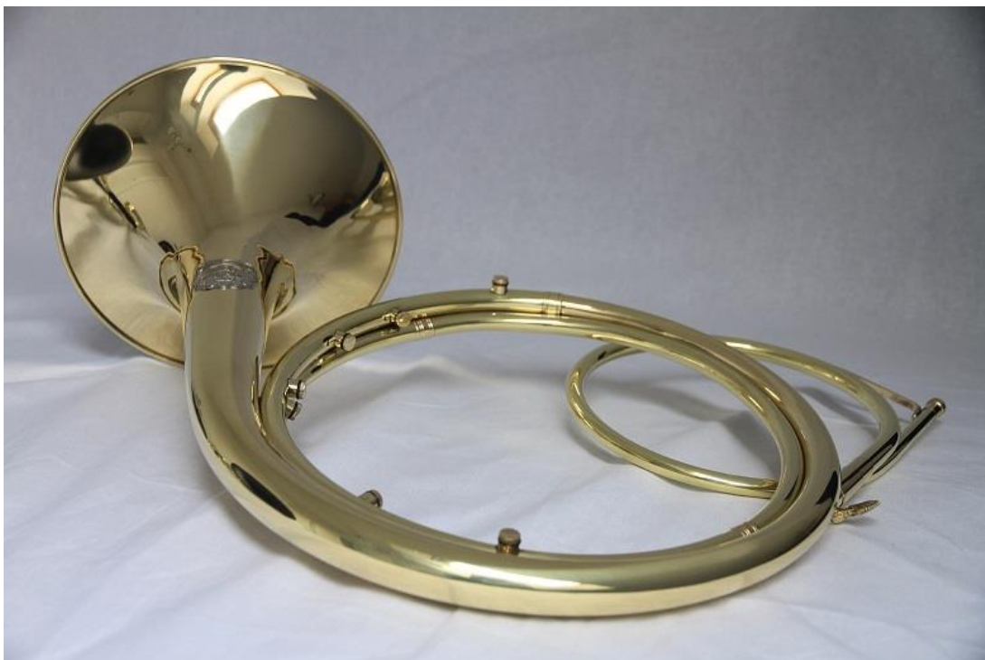
slika 5.i, barokni rog majstora Zoltána Juhásza

Možemo zaključiti kako su u odgovorima izneseni različiti stavovi ispitanika, koji uglavnom teže idealu otvorenog zvuka i prirodne boje tona baroknog roga, zbog čega se stječe dojam da korekcije pojedinih intonativno suspektih tonova stavljaju u drugi plan. Tu činjenicu potvrđuju i slike na kojima su lijevci zvučnika podignuti u zrak. Evidentno je da za iznalaženje točnih odgovora na pitanja o ispravnom sviranju baroknog roga potrebno provesti još puno istraživanja, a nova saznanja, kao i već postojeće argumente, promišljeno analizirati.