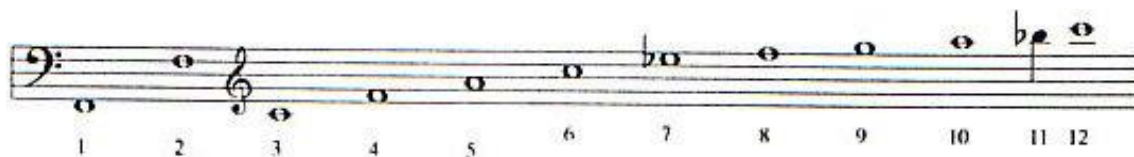
notni zapis 2.

(notni zapis 2.), a F i A postaju upotrebljive note kao osmi i deseti alikvotni tonovi niza temeljenog na noti F.