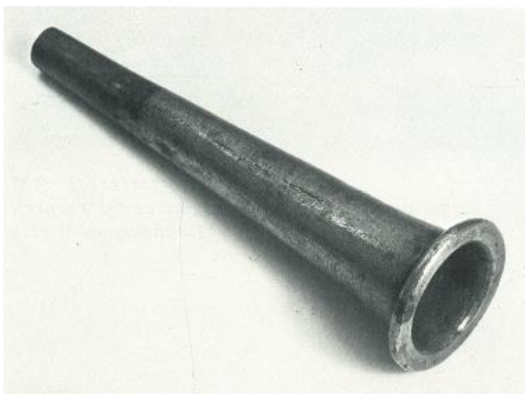
slika 4.1.g, barokni usnik

Moderni usnik, smatra Katte, nije kompatibilan za sviranje baroknog roga, a razlog tome je oblik unutar usnika nalik slovu „U“. Kod baroknog je usnika oblik unutrašnjosti nalik slovu „V“ (prikazan na slici 4.1.g), a sâm usnik dimenzijama mnogo dulji od onog modernog, budući da do cca 1800. g. usnici nisu imali najuži i najduži dio koji se stavlja direktno u glavnu cijev.