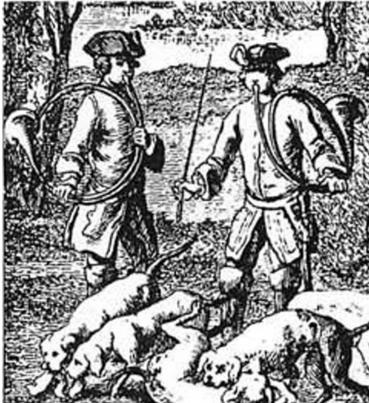
Slika 2.a, detalj iz scene lova

Tijekom povijesnog razvoja roga susrećemo se s njegovim raznim verzijama, od ranih prirodnih životinjskih rogova (koji su se koristili za signale vojnih napada ili za lov na divljač), sve do današnjih modernih rogova (namijenjenih solističkom i orkestralnom muziciranju).