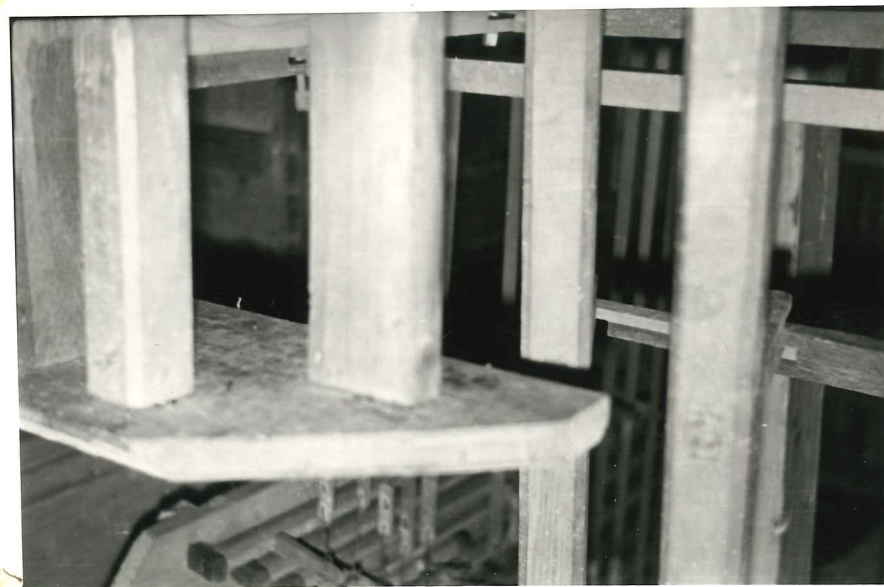
Ove orgulje imaju mehaničku trakturu (abe- strakti).

Uopće, ove orgulje ostavljaju di- van dojam već na prvi pogled i kao da su organski izrasle iz čitave arhitektonike a ne da su tamo postavljene. Pravi doživljaj daju kada ih i slušamo. Taj sklad zvukova, stila i cijele barkone arhitektonike čine rijetku impresiju. Akustika same crkve je izvanredna pa se zvuk, kako jakih regista- ra tako i tiho intoniranih, dobro širi, ra- zlikuje i čuje.