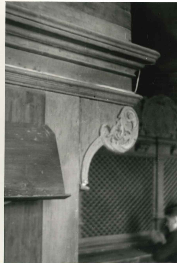
Detalj baroknog ukrasa na orguljama.

Vanjština ormara koji je arhitektonski u skladu s cijelom crkvom čini stilsku cjelinu i sa samom ogradom kora. Čiste linije je baroka s razmjerno malo ukrasa daju ve ličanstven dojam gledaocu.