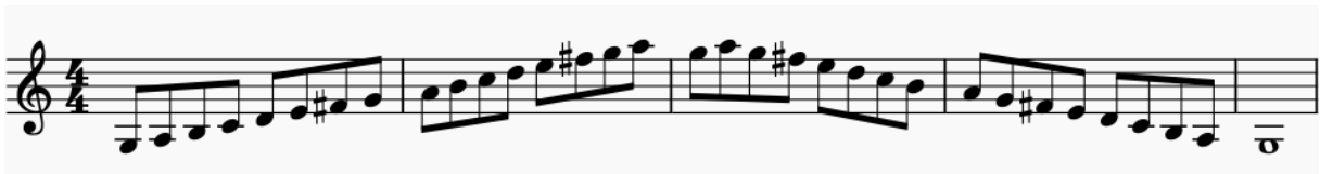
3.1 b.) Obrazac ljestvice u jednoj poziciji

Vježbu započinjem G-dur ljestvicom kroz dvije oktave te po završetku sviram isti obrazac polustepen više, odnosno u As-duru, te na takav način kroz polustepene dolazim do završne ljestvice koja je ponovno u G duru. Prstomet je za svaku ljestvicu isti (osim za početni G dur koji koristi praznu G žicu) te se cijeli obrazac transponira za polustepen iznad.