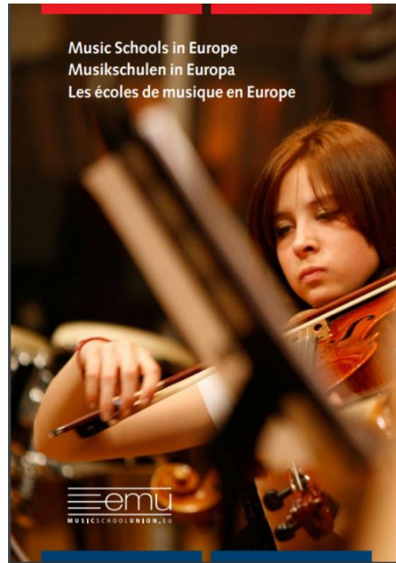
Slika 4: Glazbene škole u Europi (eng. Music Schools in Europe) (EMU, 2010)

Opisom će biti obuhvaćeni: (1) kvalifikacijski ispiti; (2) predškolski glazbeni odgoj te istaknute metode i programi; (3) programi za nadarene učenike; (4) solfeggio i teorija glazbe; (5) kurikulum. Obrazložene su gotovo sve metode i programi kako bi se pružio što bolji uvid u sustave glazbenog obrazovanja u navedenim državama.