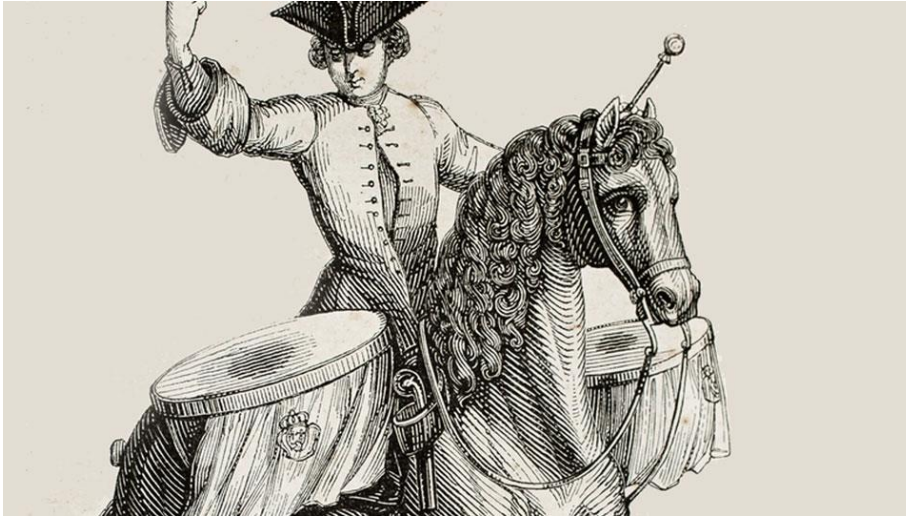
Slika 1. Naker koji se koristi u vojne svrhe

Tijekom 15. i 16. stoljeća vladari i kraljevi zapošljavaju prve timpaniste na dvorovima. Godine 1675. Jean Baptiste Lully napisao je operu Thesee u koju uvodi timpane naštimate na C i G. Nakon njega skladatelji sve češće uvode timpane u svoje skladbe. U 19. stoljeću Ludwig van Beethoven koristi timpane kao melodijski instrument. Timpani sviraju akorde ili imaju solo odlomke poput onih u Devetoj simfoniji .