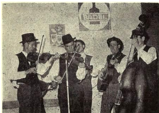
Slika 3. „Gudački sastav TD Bedekovčina“ (1968.) 11