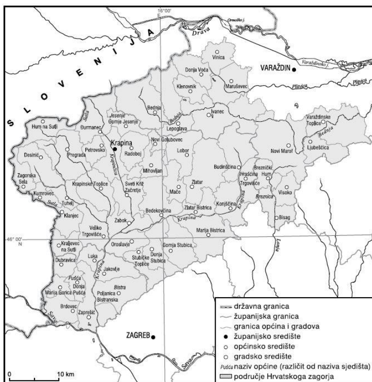
Slika 1. Karta zagorskog područja s prirodnim granicama 3

„Međutim valja reći i to, da je pučanstvo ovih prostora odigralo u političkom i kulturnom životu Hrvata važnu ulogu. U teškom stoljećima mukotrpane borbe za goli opstanak niti jedan osvajač nije mogao pregaziti i slomiti, čvrsto, hrabro, žilavo i 'puntarsko' Zagorje. Ali isto tako treba reći, da je ono u gospodarskim i razvojnim stremljenjima u svim burnim mijenama politika i država, čiji je dio bio, uvijek ostao negdje „po strani“ oslonjeno samo na sebe i svoje škrte resurse, ali prepuno ljepota satkanih od brežuljaka i dolova, mineralnih vrela i dvoraca, srednjovjekovnih gradina i kurija te drugih ostataka davnih i pradavnih doba“ 2