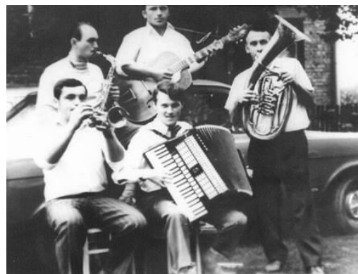
Slika 4. „Veseli kvintet“ (1968.) 10