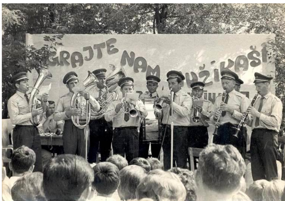
Slika 5. Limena glazba „Mrzlo Polje“ (1970.) 12

Iako su u tim prvim godinama festivala sastavi bili raznoliki, uključujući čak i poneke „KUD“ – ove, značajnije su rezultate i popularnost među publikom ipak uživali lokalni bendovi (sastavi koji su najčešće uključivali trubu, klarinet, bariton, harmoniku i gitaru te kombinacije sličnog instrumentarija), stoga su od kasnih 70-ih godina nadalje upravo oni dominirali festivalskom scenom.