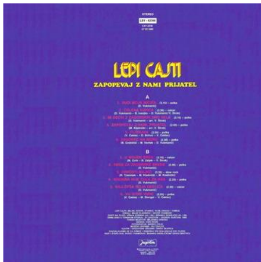
Slika 6. LP ploča albuma „Zapopevaj z nami prijatel“, Jugoton, 1989. 26

U pjesmu nas uvodi kratki instrumental u kojem zvukovno dominiraju truba i klarinet, svirajući u paralelnim tercama. Glavna melodija koja se izvodi u dionici trube, skokovitog je karaktera i ponavlja se dva puta – kod drugog ponavljanja kadenca je drugačija (završetak na I. stupnju). Uz glavnu melodiju i njezinu pratnju klarineta u intervalu terce, u pozadini čujemo akordičku pratnju harmonike, koja se pojavljuje u istom ritmičkom obrascu do završetka pjesme. Sličnosti koje dijele glavna melodijska linija i akordička pratnja najviše se očituju u