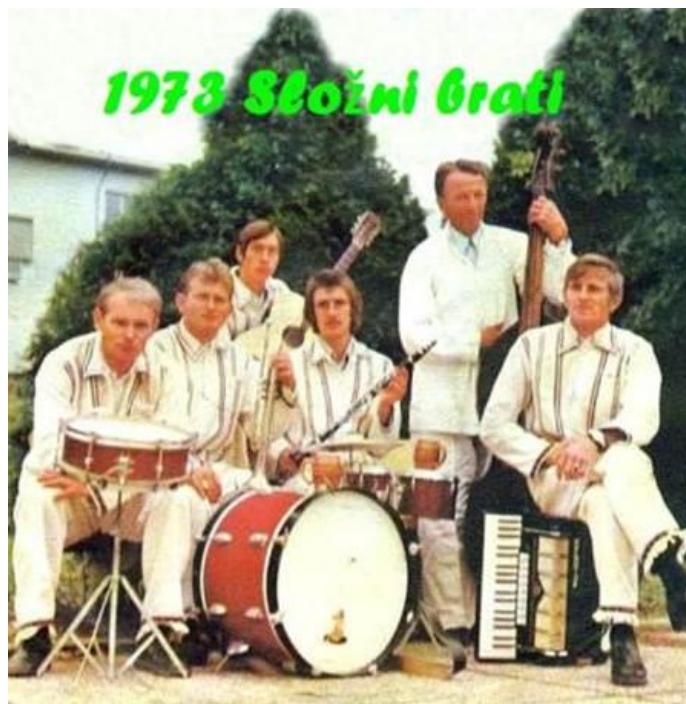
Slika 2. Prikaz tipičnog instrumentarija zagorskog sastava druge polovice XX. stoljeća; Sastav „Složni brati“, 1973. 7

dogadjanja poput otvaranja novog rudnika, češki su rudari nastupali u sastavima tradicijskih „limenih glazbi“. 6 Preuzimanje instrumenata poput trube, klarineta i baritona od navedenih orkestara te njihovo kombiniranje s tada popularnim, domaćim tamburaškim zvukom rezultiralo je stvaranjem novog, specifičnog glazbenog izričaja. Zagorci bi često i sami izrađivali navedene instrumente, a rjeđe bi ih kupovali od čeških rudara. S vremenom je svoje mjesto u takvim sastavima pronašla i harmonika, koja i danas predstavlja jedan od simbola zagorske zabavne glazbe. Takav tip „kombiniranog“ sastava u narodu se nazivao „jazz“ (sve do 70-ih godina), a predstavljao je najčešće peteročlani ansambl trube, klarineta, harmonike, gitare i basa. Odmakom od tamburica i dodavanjem električnih instrumenata i bubnjeva, krajem XX. stoljeća, taj se zvuk transformirao u glazbeno „zabavniji“ oblik. No, s obzirom da je žanr u svojim počecima nadilazio nacionalne teritorijalne granice, postavlja se pitanje može li se takva glazba nazivati isključivo zagorskom? Iako se u suvremenom kontekstu zagorskoj glazbi često pripisuje „slovenski prizvuk“, činjenica je kako je prvi festival takvog tipa glazbe pokrenut upravo na području Zagorja („Igrajte nam mužikaši“, 1968.), dok je u Sloveniji do iste inicijative došlo tek godinu danas kasnije („Festival narodnozabavne glasbe Ptuj“, 1969.).