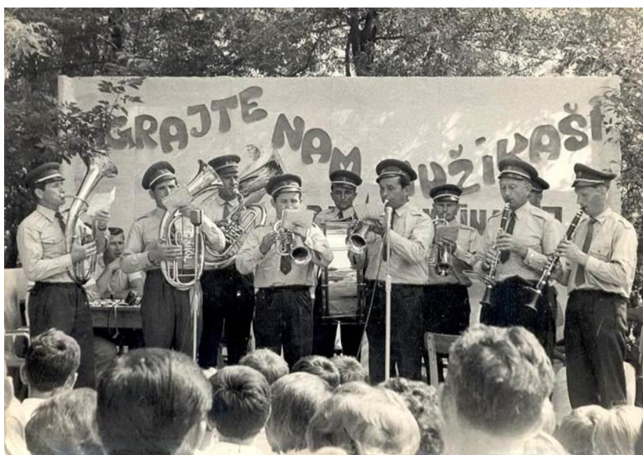
Slika 5. Limena glazba „Mrzlo Polje“ (1970.) 12

Iako su u tim prvim godinama festivala sastavi bili raznoliki, uključujući čak i poneke „KUD“ – ove, značajnije su rezultate i popularnost među publikom ipak uživali lokalni bendovi (sastavi koji su najčešće uključivali trubu, klarinet, bariton, harmoniku i gitaru te kombinacije sličnog instrumentarija), stoga su od kasnih 70-ih godina nadalje upravo oni dominirali festivalskom scenom.