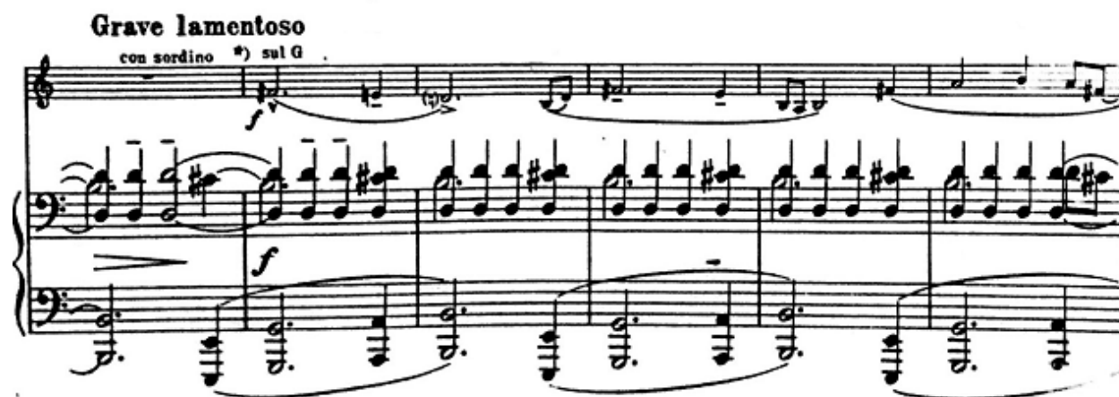
Notni primjer 23: Druga tema uz ostinatnu pratnju

U trećem dijelu „Allegro agitato“ se ponovno javlja ostinatna akordična pratnja iz prvog dijela, ali za pola tona više. Motivi violinske dionice se isto tako temelje na prvoj temi skladbe, iako je pozicionirana u gornjem registru i također za pola tona više nego prvi put. Napetost raste do kulminacije u dijelu „Sauvage Balcaniques“ s repetiranim clusterima u klavirskoj dionici.