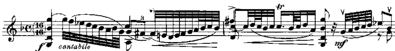
Notni primjer 1: Adagio, takt 1 – 2

Prevladava ekspresivni francuski stil, slobodan u tempu i agogici te bogat ornamentima. Sa svojom raznobojnom harmonijom i ekspresivnom melodičnošću je stavak lijep uvod u sonatu.