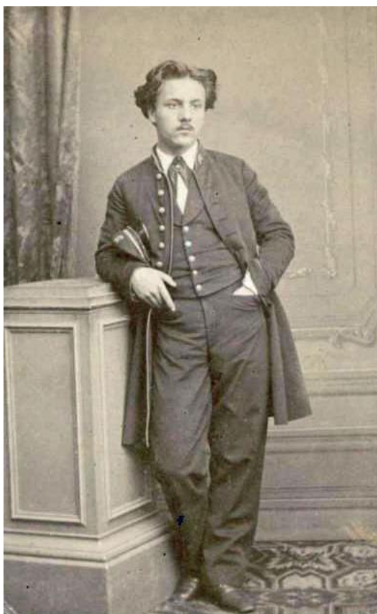
Gabriel Fauré u uniformi škole Niedermeyer