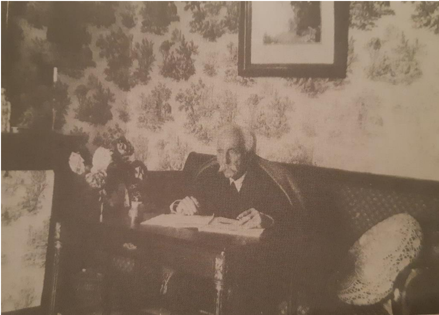
Gabriel Fauré u sobi u Annecy-le-Vieuxu, 1924. godine

U jutro 3. studenog 1924. godine, već poprilično slab i u velikim bolovima, Fauré je pozvao svoje sinove nasamo te im rekao: