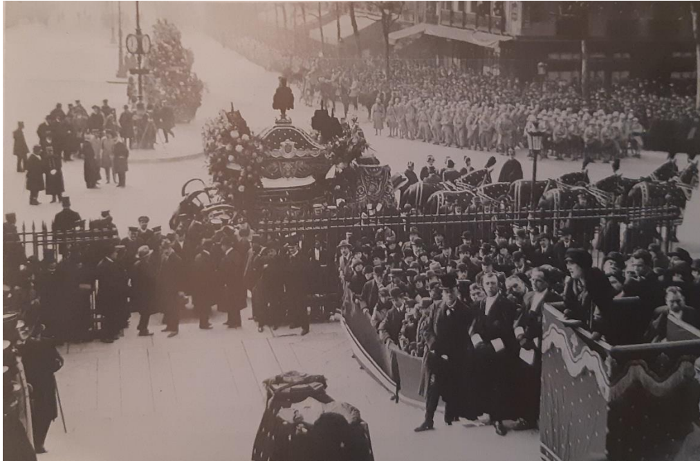
Sprovod Gabriela Faur a

pariške opere i orkestar Soci t  des Concerts du Conservatoire izveli su, izme u ostalog, jednu od Faur ovih najuspješnijih kompozicija – Requiem .