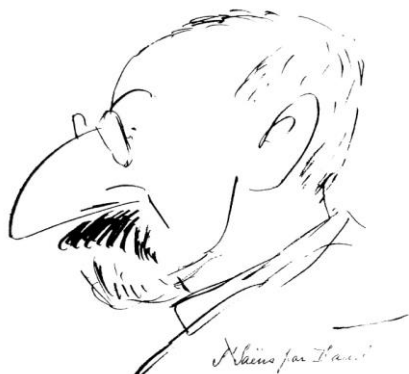
Fauréova karikatura svog učitelja, Camilla Saint-Saënsa

„To je zaista moja prva kompozicija, napisana u školskoj blagovaonici ispunjenom mirisima kuhinje... a moj prvi izvođač bio je Saint-Saëns.” 26