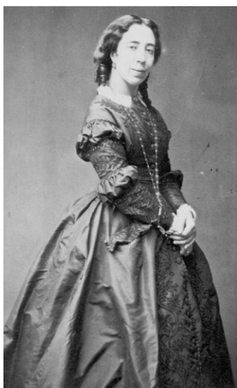
Proslavljena mezzosopranistica Pauline Viardot