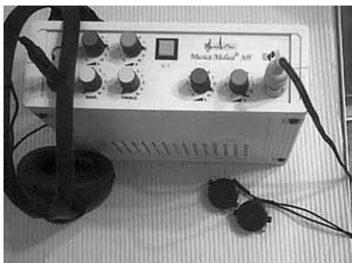
Slika 7. Musica medica - terapijski set 128

Musica Medica namijenjena je slijepim osobama, osobama oštećena sluha kao i osobama s nekim drugim poremećajima poput disleksije, hiperaktivnosti, autizama, psihičkih poremećaja depresije, shizofrenije itd. 129