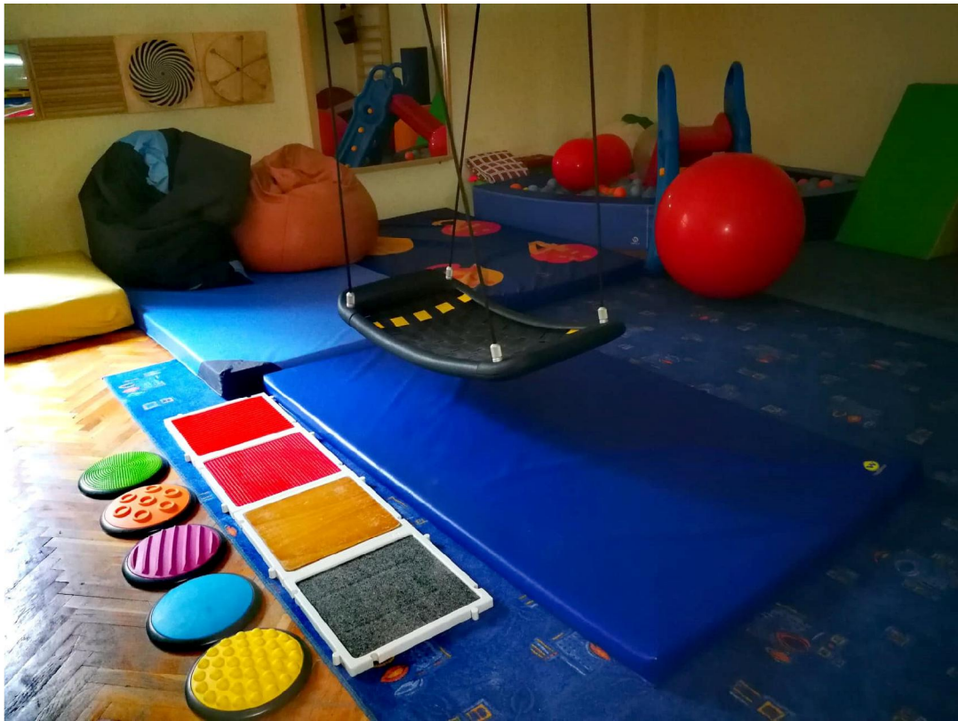
Slika 6 Soba za senzornu integraciju u Centru za autizam Zagreb 121

Poput drugih odgojno-obrazovnih sadržaja, u Centru za autizam, tako i sadržaji glazbene kulture slijede kalendarsku i crkvenu godinu, tj. određene melodije povezuju se uz određeno godišnje doba ili blagdan, čime se postiže organizirani protok vremena. Glazbene stimulacije ispunjene su raznim glazbenim sadržajima, kako bi se svakom djetetu pružila mogućnost potpunog emocionalnog doživljaja. Djeca se mogu služiti instrumentima poput udaraljki, klavijatura te nekih puhaćih i trzalačkih instrumenata. Time dijete počinje shvaćati da zajedno s terapeutom može postići neki zadovoljavajući glazbeni oblik, što mu pruža ugodu i zadovoljstvo.