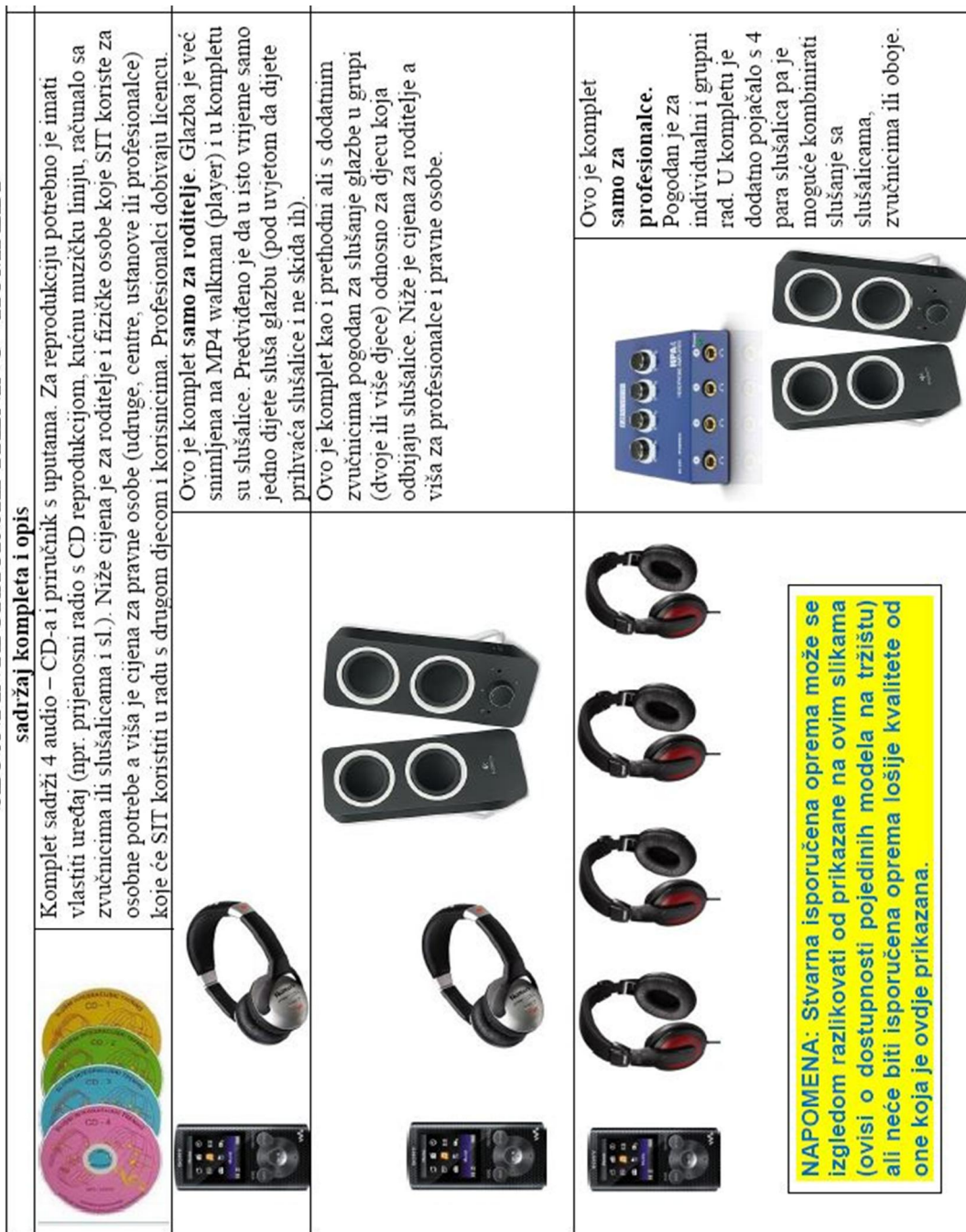
Slika 4. SIT komplet za slušni trening 109