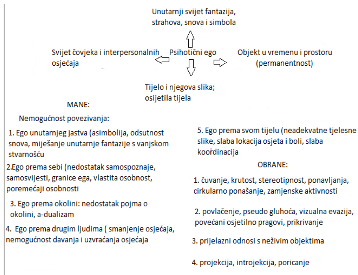
Slika 1. Ego psihotičnog djeteta prema istraživanju E. J. Anthonyja 27

Ustvrдио je kako u svim slučajevima dječje psihoze i autizma postoje komponente temeljene na tri osnovna stanja neispravnosti: nemogućnosti oblikovanja koherentnog i stabilnog osjećaja, nemogućnosti preciznog doživljaja unutarnjih iskustava i poremećaju u percepciji samoga sebe. 28