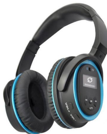
Slika 2. Slušalice Soundsory 102

(...) „Na vrhu same slušalice smješten je koštani vodič. Naime, doktor Tomatis je shvatio da mi čujemo kostima. To je zaključio i Petar Guberina koji se bavio proučavanjem govora i gesta. Guberina je gluhonijeme i slijepe učio vibracijama i frekvencijama. Stavljaio je uređaje pod ruke i noge, a mi stavljamo, zato što imamo slušalice, na glavu. Slušalice imaju kontakt s lubanjom i vibracija izlazi nekoliko milisekundi prije nego što se čuje zvuk. Ovakve slušalice koje sada vidite priprema su za Tomatis terapiju ili služe kao nastavak nakon terapije i zovu se Soundsory. Može se puštati i latino glazba i brojalice, u principu malo lakša glazba. Kod Tomatis terapije koristi se isključivo Mozartova glazba i gregorijanski koral. Kod ovih slušalica se glazba kombinira s ritmičnošću. Mozak je neuroplastičan i mora se povezati s pokretom da bi se taj živčani sustav konačno integrirao i zato se puštaju niže frekvencije koje imaju više basova, a ne samo visoke frekvencije kao što je kod Tomatisa. Glazba se izmjenjuje. Puštamo klasiku pa koračnice, malo dječjih pjesmica, malo latino glazbe i to sve skupa sa Soundsoryjem traje oko 25 minuta plus 5 minuta vježbanja jer se neke vježbe izvode motorički. (slika 2.)