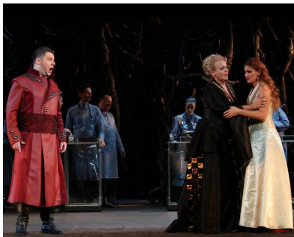
Slika VI: Opera Nikola Šubić Zrinjski u produkciji HNK Ivana pl. Zajca u Rijeci

sam uspješno otpjevao tri predstave u alternaciji s odličnim Robertom Kolarom. (slika 6.) 31