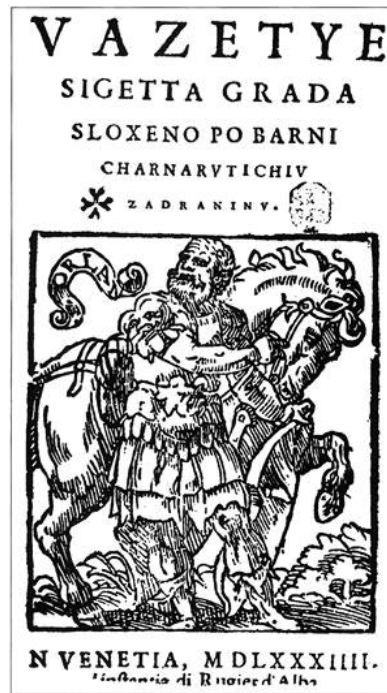
Slika III: Prvo izdanje djela "Vazetje Sigeta grada" u Mletcima 1584. godine