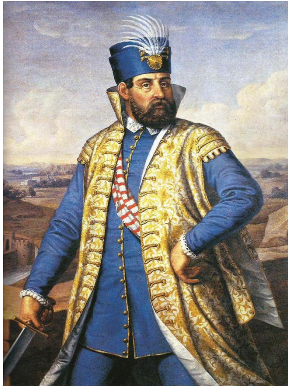
Slika 1: Nikola Šubić Zrinski

Kralj je Nikoli, za njegove vojne zasluge i uložena vlastita sredstva u obranu zemlje 1546. darovao Međimurje s utvrđenim gradom Čakovcem koji se nalaze u posjedu porodice Zrinski sve do njihova izumiranja krajem 17. i početkom 18. stoljeća. Međimurje je Zrinskima predstavljalo najveći posjed i s njime su dodatno dobili na ugledu, a ujedno, zbog teritorijalne blizine, stekli i reputaciju u Mađarskoj.