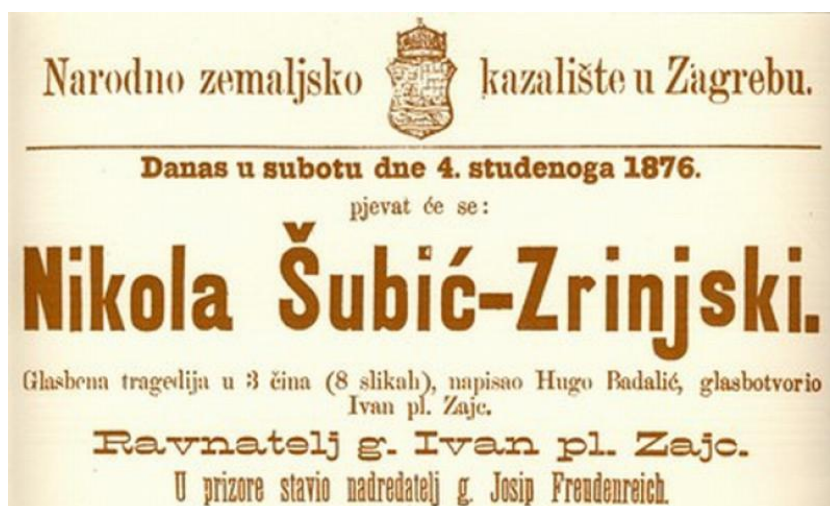
Slika IV: Slika plakata s praiizvedbe opere Nikola Šubić Zrinjski 1876. godine