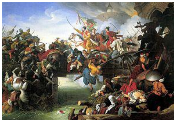
Slika II: Prikaz bitke kod Sigeta

Kobnoga 7. rujna 1566. vezir Sokolović odlučio je krenuti na sve ili ništa. Njegov je cilj bio osvajanje Beča, do kojega nikada neće uspjeti doći, ako mu pod Sigetom svakodnevno gine veliki broj vojnika. Zbog toga je odlučio topništvom razoriti grad i branitelje prisiliti na predaju. Kada je vidio da nema izlaza, Nikola Šubić Zrinski odlučio je krenuti u proboj predvodeći svoju malobrojnu vojsku. (slika 2.) 10