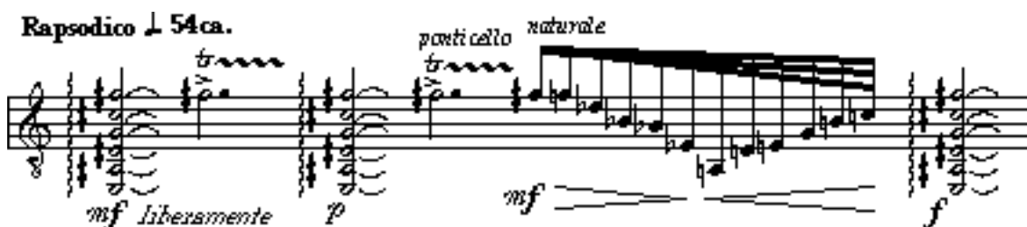
Slika 4. 3. a: A. Ginastera: Sonata za gitaru, op. 47, III. Canto, početak stavka (prvi red)

Treći stavak, Canto 9 , koji je pisan bez taktnih crta, sadrži 16 redova i karakterno je povezan s prvim stavkom. Poput Esordia , cjelokupna forma je A B A' B', opet s kreolskim folklornim gitarskim elementima koji dominiraju dijelom A nakon kojeg se javlja kontrastni dio B. Sam početak stavka predstavlja arpeggirane akorde, baš kao i početak Esordia . Isti akord se ponavlja tri puta, s isprepletenim trilerima i figurom koja se par puta javlja u variranoj formi. Stavak se bazira na tonu fis.