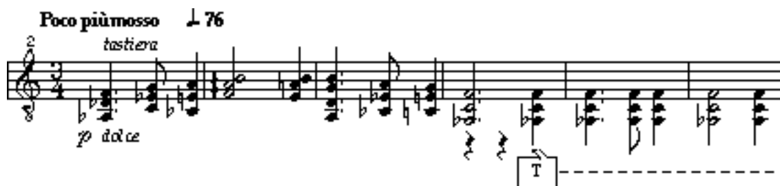
Slika 4. 1. b: Alberto Ginastera, Sonata za gitaru, op. 47, I. Esordio, 2. stranica, taktovi 1-6

Melodija je inspirirana andskim glazbenim karakteristikama i generalno je sporog tempa što je tipično za bagualu i vidalu čije su karakteristike trodobna mjera s punktiranim ritmom te imitacija bubnjeva ( caja ) raznim udarcima ( golpe , tambora ) desnom rukom. Predstavlja noćni pogled s argentinskih planina ( pampas ), razliku i kontrast između svijetla i tame, noćnog krajolika, dinamičkih kontrasta, nadrealističkih dojmova 7 .