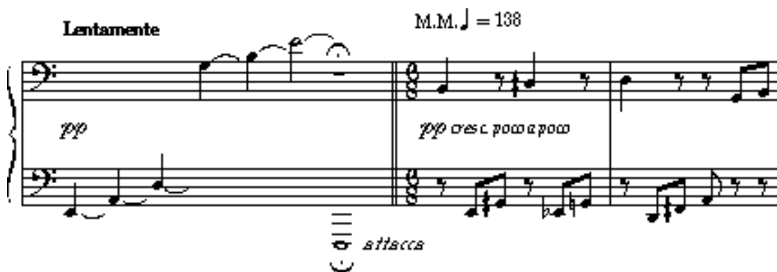
Slika 4.1. a: Alberto Ginastera, Malambo za solo klavir, (1940) taktovi 1-3.

Gitarski akord (E-A-d-g-h-e1) koji se javlja tijekom cijelog prvog stavka sonate, skladatelj je osobni potpis u mnogim njegovim djelima. Stoga i ne čudi da je Ginastera odlučio započeti Sonatu za gitaru upravo na taj način i konačno prikazao gitarski akord na izvornom instrumentu.