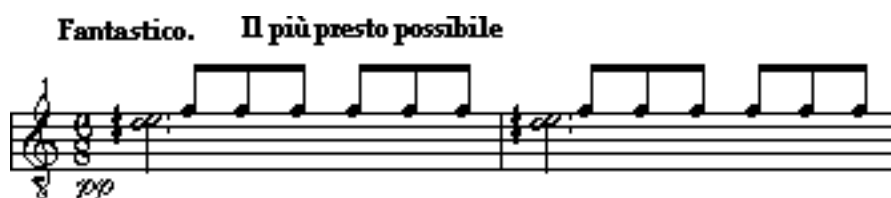
Slika 4. 2. a: A. Ginastera: Sonata za gitaru, op. 47, II. Scherzo taktovi 1-2

Drugi stavak sonate Scherzo , ritmički i energijski predstavlja muški ples gauchosa u 6/8 mjeri koji u Sonati skladatelj u uputama naglašava „ Il più presto possibile ”. Početak stavka tipičan je za kreolske gitariste Južne Amerike.