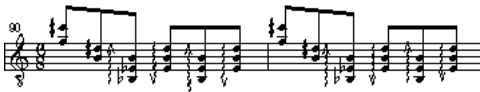
Slika 4.4. b: Alberto Ginastera, Sonata za gitaru op. 47, Finale, taktovi 90-93

Brojni su kratki segmenti koji se mogu povezati s drugim argentinskim narodnim plesovima poput chacharere ili milonge 11 . Primjer chacharere nalazi se u taktovima 90-93 (slika 4.4. b)