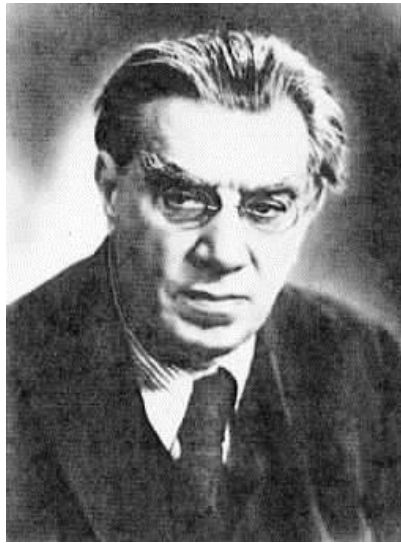
Slika 2 (Reinhold Glière)

Reinhold Moricevič Glière rođen je tridesetoga prosinca 1874. godine (po starom kalendaru) u Kijevu kao drugi sin Ernsta Moritza Glierea i Josephine Korčak. Iako neki glazbeni rječnici, knjige i prilošci snimkama njegovih djela tvrde da je bio sin židovskih roditelja belgijskog podrijetla, te tvrdnje mogu se odbaciti kao netočne budući da postoji dvojezični ruski i njemački krsni list Reinholda Glierea u kojem se navodi da je kršten u Protestanskoj luteranskoj Kijevskoj crkvi. Njegov otac rođen je u Klingenthalu (Njemačka), gdje je obitelj Glière živjela stoljećima. Ernst je također bio uspješan graditelj instrumenata, specijaliziran za puhačke instrumente. Reinholdova majka, Josephine Korčak, bila je kći poljskog graditelja instrumenata i s njegovim se ocem nedvojbeno upoznala putem njihove zajedničke profesije. Stanly D. Krebs, autor djela Sovjetski skladatelji i razvoj sovjetske glazbe , navodi kako Reinholdovi roditelji nisu željeli da njihov sin živi od glazbe već su smatrali da bi posao doktora ili strojara bio isplativiji i osigurao mu svjetliju budućnost, no njihov položaj u tadašnjem carskom društvu ograničio je broj opcija za Reinholdovo obrazovanje.