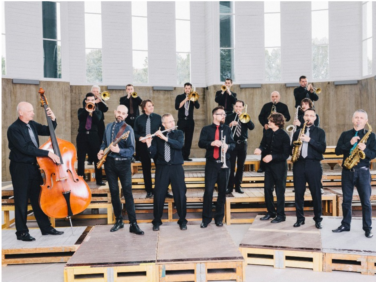
4.1. Jazz orkestar Hrvatske Radio-televizije