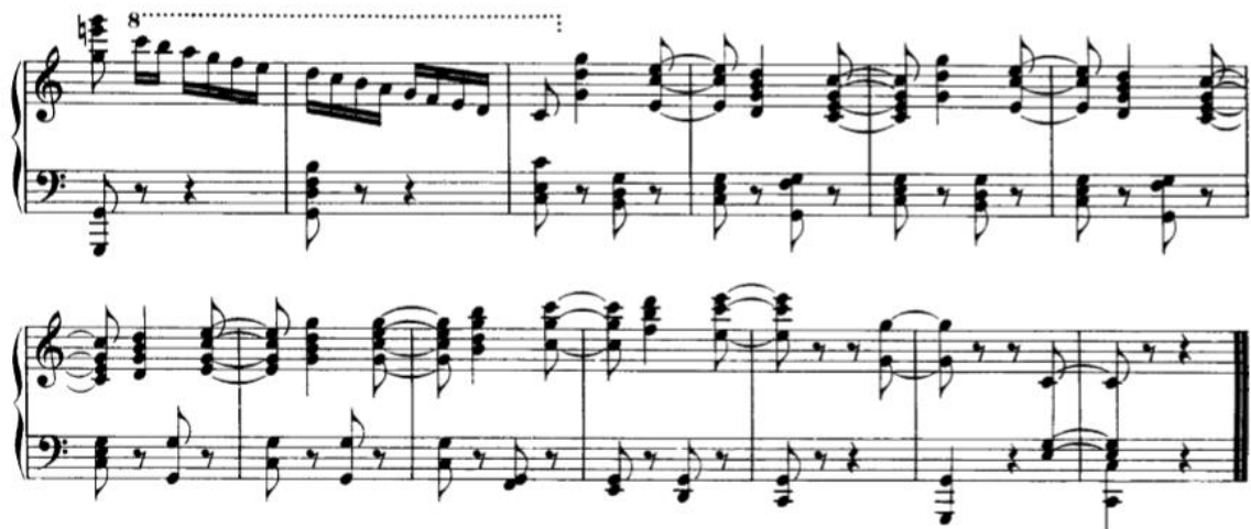
Slika 3.3.c, taktovi 249-251

Ponovni nastup A dijela uvodi nas u virtuoznu codu koja je možda energetski najimpulzivniji dio ciklusa. Ona sadrži ritmičke i melodijske elemente A dijelova i kao takva zaključuje ovaj ciklus.