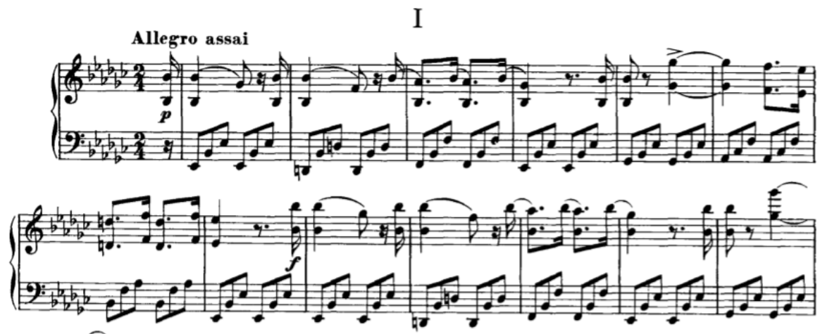
Slika 3.1.a, taktovi 1-16

Prvi klavirski komad označen je tempom allegro assai , a pisan je u tonalitetu es-mola. Forma ovog oblika je A-B-A. A dijelovi pisani su u es-molu, dok je srednji B dio pisan u H-duru. Prvih šesnaest taktova formirana su kao dvije velike glazbene rečenice (8+8). U desnoj ruci je glavna melodija, a u lijevoj jasna pratnja u ritmu triola. Tu konstantno dolazi do sukoba ritma, jer se šesnaestinke u desnoj ruci suprotstavljaju triolama u lijevoj. Ove dvije velike glazbene rečenice su doslovno ponovljene, samo što je druga pisana za oktavu više, a i dinamički je oprečna prvoj. Obzirom da je melodija u desnoj ruci, ona ovdje dinamički prevladava, a pratnju treba diskretnije i tiše svirati. Posebno treba pripaziti da se ritam triola u lijevoj ruci ne „lijepi“, već da prsti aktivno sviraju, i jasno pokažu promjenu harmonije – što se događa na svakoj prvoj osminki. Šesnaestike u desnoj ruci moraju biti ritmički precizno određene, dok s druge strane ne smiju zvučati grubo.