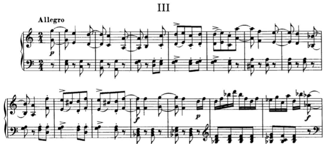
Slika 3.3.a, taktovi 1-14

Treći klavirski komad, u tempu Allegro , ponovo je jednostavnog A-B-A oblika, a kao takav sadrži dva velika kontrasta među dijelovima. A dio sadrži karakter virtuozne i radosne energije, prevladavaju sinkope praćene akcentima, a zastupljene su i nagle promjene dinamike. Funkciju nositelja ritmičnog života ima lijeva ruka, zbog čega bi trebalo dati diskretno do znanja svaku prvu dobu u taktu. Materijal A dijela podjeća čak i na narodnu glazbu, pogotovo ako ga promatramo s ritmičkog aspekta. Sve note u A dijelu treba svirati kristalno čisto, a akcente što jasnije.