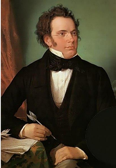
Slika 1.1.a, Franz Peter Schubert

Franz Peter Schubert (Himmelfortgrund 31. siječnja 1797. – Beč 19. studenog 1828.) austrijski je skladatelj, jedan od prvih i glavnih predstavnika romantizma u glazbenom stvaralaštvu. Rođen je kao trinaesto od šesnaestero djece učitelja Franza Theodora Schuberta i domaćice Elizabeth Vietz. Schubertov interes za glazbom prije svega polazi od njegova oca, koji je imao vlastitu školu u Lichentalu. Upravo je od njega Schubert u dobi od pet godina počeo dobivati redovitu poduku, a godinu dana kasnije upisan je i u očevu školu, čime je započela njegova formalna glazbena naobrazba. Otac ga je učio osnovama violine, a od brata je dobivao poduku iz klavira. U dobi od sedam godina primao je i poduku iz pjevanja, harmonije i orgulje od Michaela Holzera, orguljaša i vođe zbora crkve u Lichtentalu. Svirao je i violu u obiteljskom gudačkom kvartetu s braćom Ferdinandom i Ignazom, zbog čega su upravo neka od njegovih prvih djela