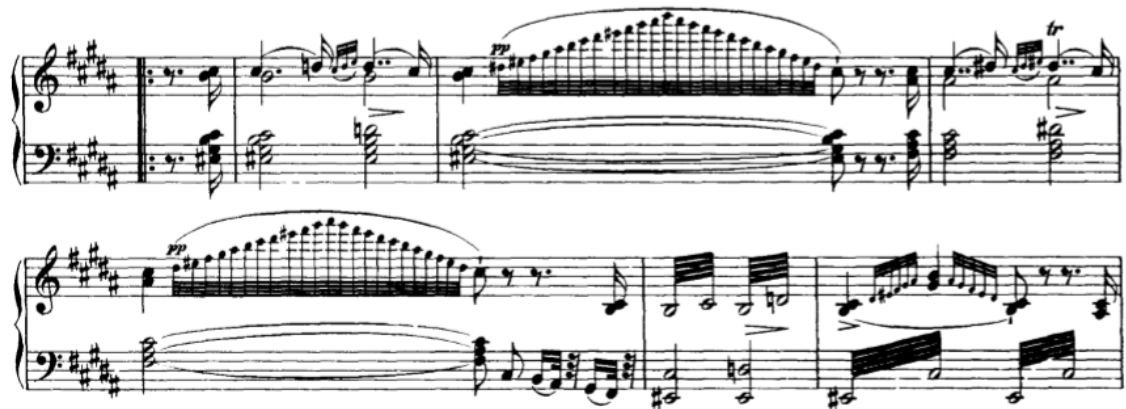
Slika 3.1.f, taktovi 124-129

Od 124. do 135. takta nanizano je šest dvotaktnih fraza. Ovdje su posebno interesantni taktovi 125 i 127 koji imaju veoma brze ritmične figure koje treba odsvirati s posebnom lakoćom kako bi zvučali kao određeni improvizatorski efekti, koji pomalo podsjećaju na česte Lisztove figure primjerice u mađarskim raspodijama.