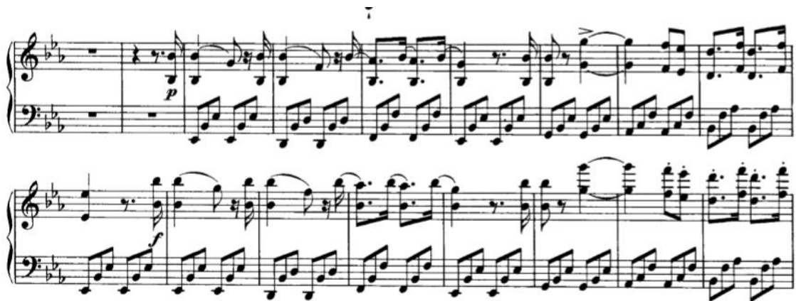
Slika 3.1.c, taktovi 57-74

Od 57. do 74. takta, uz jedan dvotakt u obliku pauze, imamo ponovno dvije velike glazbene rečenice (4+4) kao s početka, međutim za razliku od es-mola, ove su pisane u Es-duru i sve je ostalo identično.