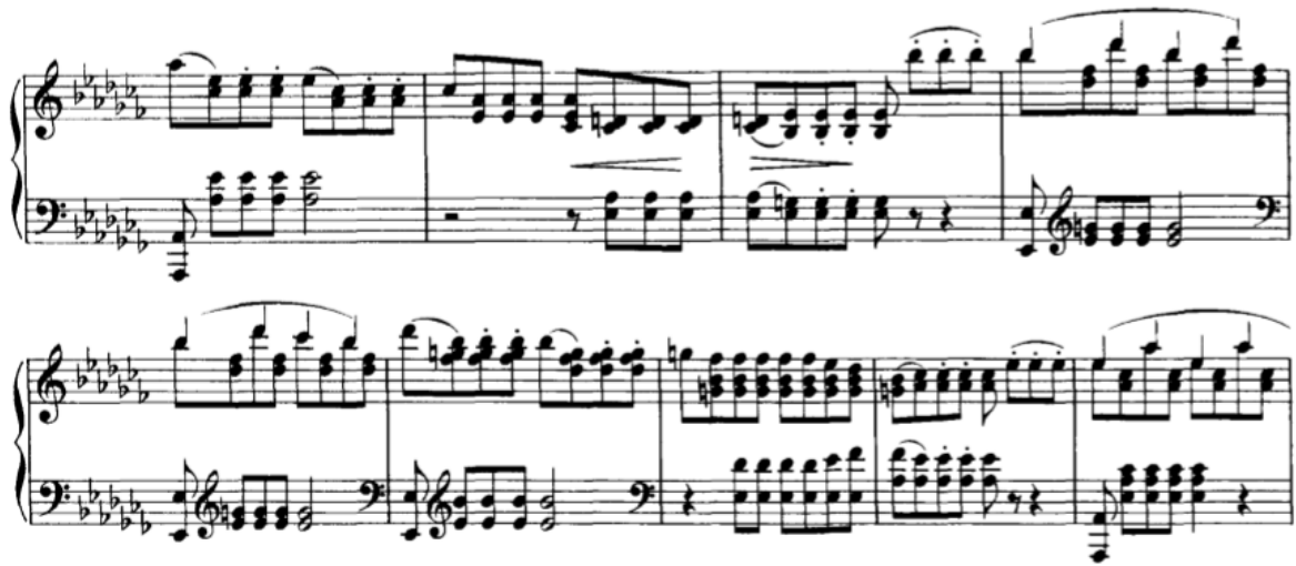
Slika 3.2.e, taktovi 115-123

fraza, a svaka od njih nastupa kao zasebna harmonijska cijelina. U 139. taktu kreće modulacija prema h-molu koji nastupa u 141. taktu.