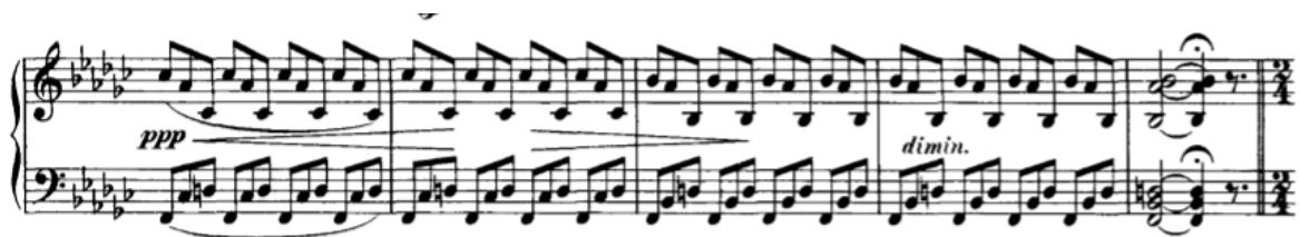
Slika 3.1.h, taktovi 151-155

Od 151. do 155. takta je prijelazni dio koji ponovno modulira u es-mol, nakon čega slijedi doslovno ponovljeni A dio.