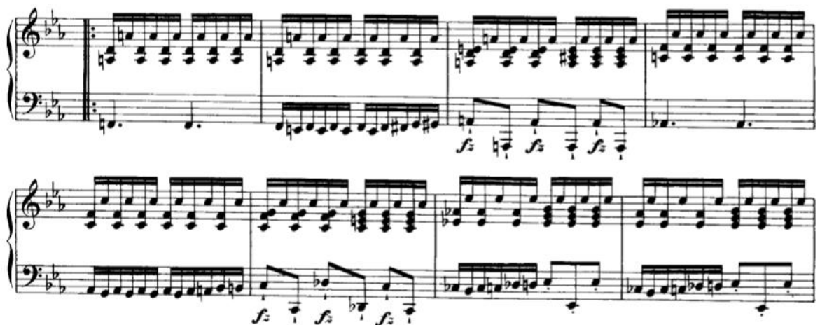
Slika 3.2.c, taktovi 46-52

Od 46. takta situacija postaje obrnuta, u desnoj ruci dolaze šesnaestinke, dok je melodija u lijevoj ruci. Melodija je sada u tamnijem registru pa je važno da bude što kristalnije ali nenametljivo odsvirana. Tu će se pojaviti crescendo koji počinje u 54. taktu i vodi sve do 59., kada nastupa novi materijal.