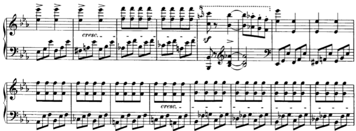
Slika 3.1.d, taktovi 74-88

ruci su i dalje triole koji imaju funkciju nosioca harmonije, dok u desnoj ruci imamo melodiju kombiniranu u ritmu četvrtinki i osminki. Obzirom da se od 82. do 90. takta u desnoj ruci kontinuirano sviraju iste note, vrlo je važno paziti da iste ne bi zvučale naporno i dosadno, stoga kao pomoć možemo iskoristiti tonove iz lijeve ruke koji određuju harmoniju, a u desnoj recimo naglašavati samo promjene harmonijske strukture. U 90. taktu je vrhunac dinamičke gradacije koja kreće od 74. takta, pa je važno da fz vertikalni momenti budu masivni i čvrsti, a između toga precizne izmjene stacatto i tenuto akorada.