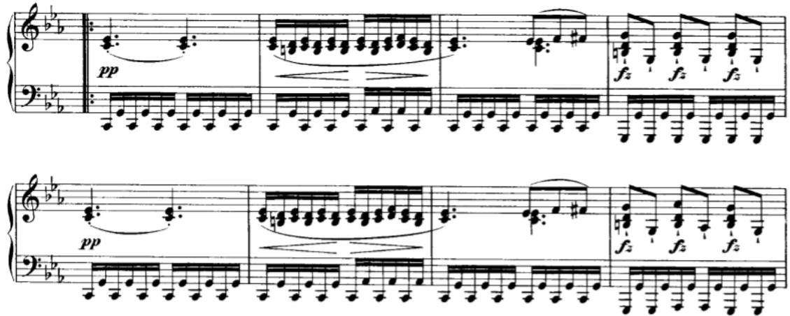
Slika 3.2.b, taktovi 32-39

staccato akordi koji moraju nastupiti subito , ali ne smiju postati agresivni. Od 32. do 45. takta nižu se su tri male glazbene rečenice i jedna dvotaktna fraza.