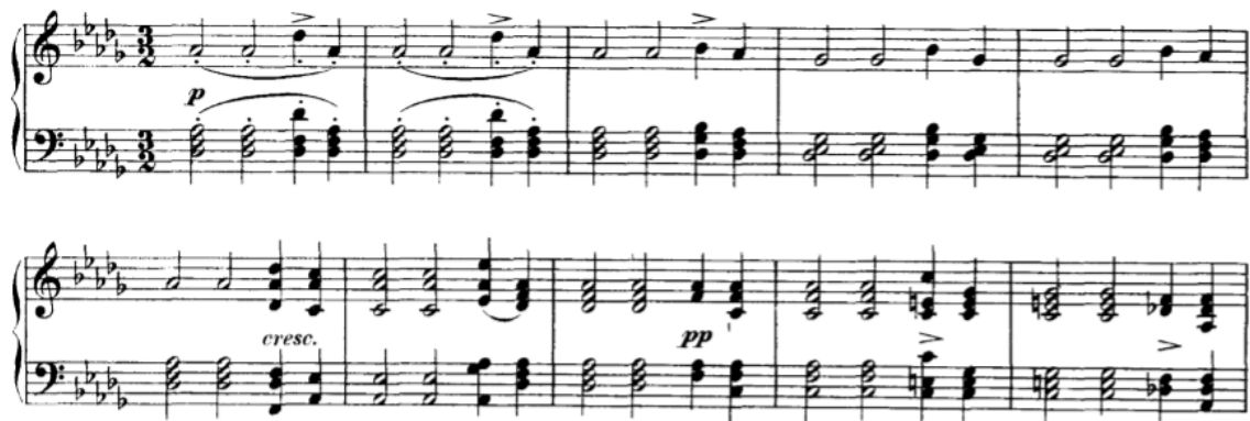
Slika 3.3.b, taktovi 74-83

rečeno, karakterno je suprotan. Materijal je duhovan, a tonalitet više nije C-dur nego Des-dur, uz poneke modulacije u as-mol, es-mol i Ges-dur.