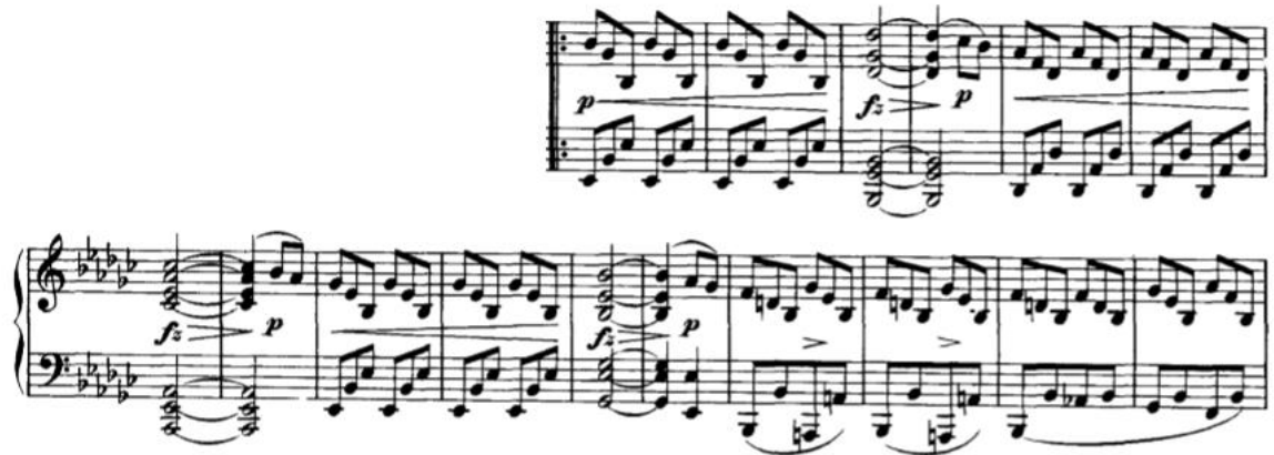
Slika 3.1.b, taktovi 17-32

koncentriramo na pojedine note, nego na svaku od njih. Zbog toga je važno da se te note odsviraju s posebnom pažnjom kako bi slušatelj u svim osminkama-triolama uspio čuti glavnu melodiju – oblikovanu frazu. Ove matematički pravilne fraze prati i jasan dinamički plan, u većini slučajeva praćen crescendima ili decrescendima.