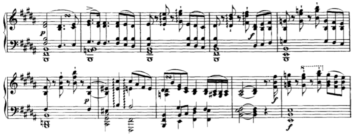
Slika 3.1.g, taktovi 136-145

Od 151. do 155. takta je prijelazni dio koji ponovno modulira u es-mol, nakon čega slijedi doslovno ponovljeni A dio.